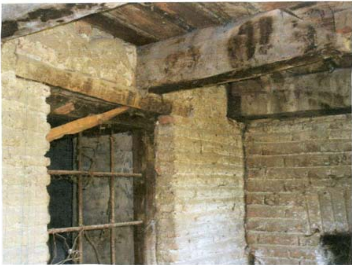
სურ. 37- ჭერი სარდაფის შესასვლელი.