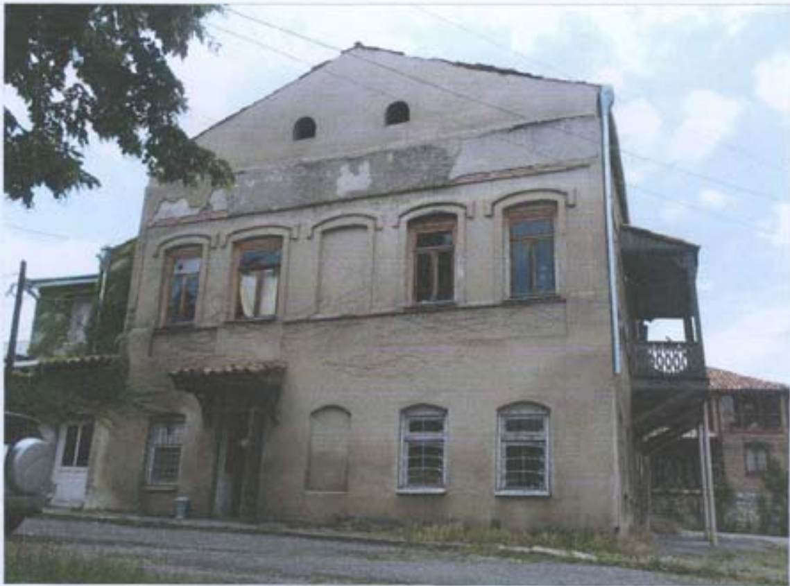
სურ. 1- აღმოსავლეთის ფასადი.