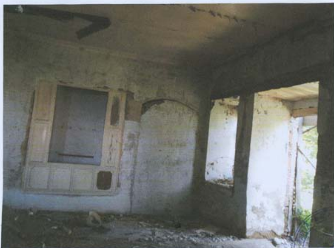
სურ. 16- ნეორე ოთახი შენობის ადრეულ ნაწილში.