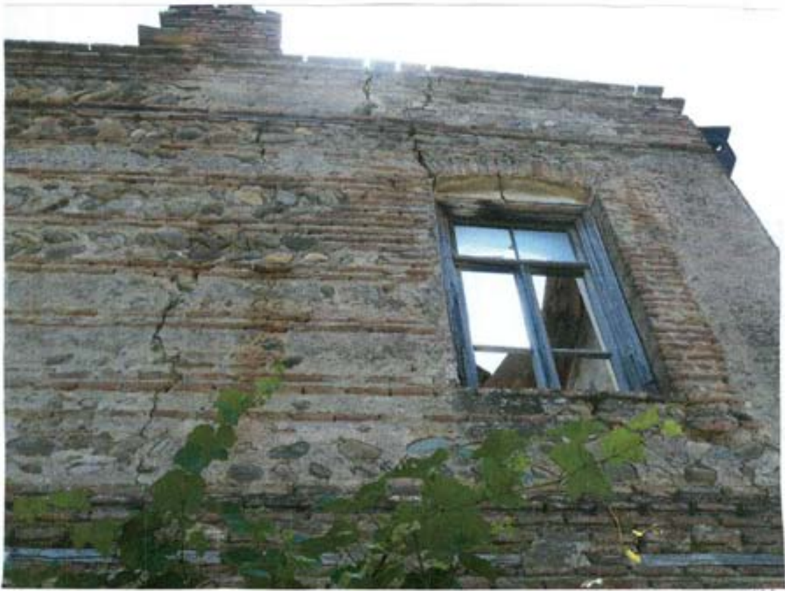
სურ. 27- დაზიანებები სამხრეთ-დასავლეთის კუთხეში.