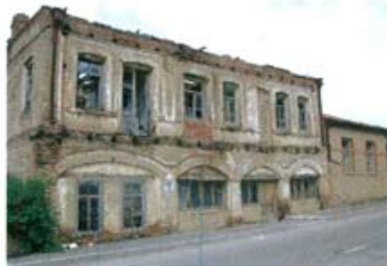
ი. ჭავჭავაძის ქ. №186 ფასადი ქუჩის მხრიდან