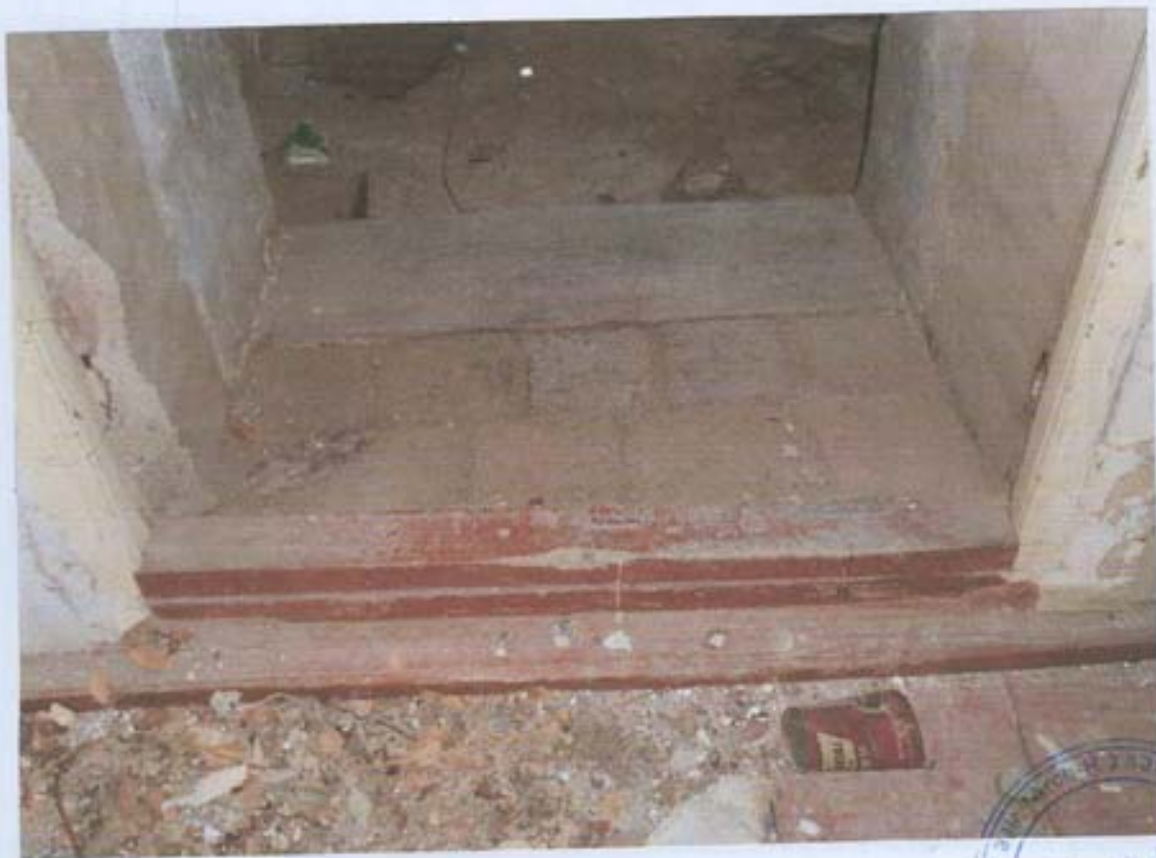
სურ. 20- ბუბრიან ოთახში შესასვლელი კარის იატაკი.