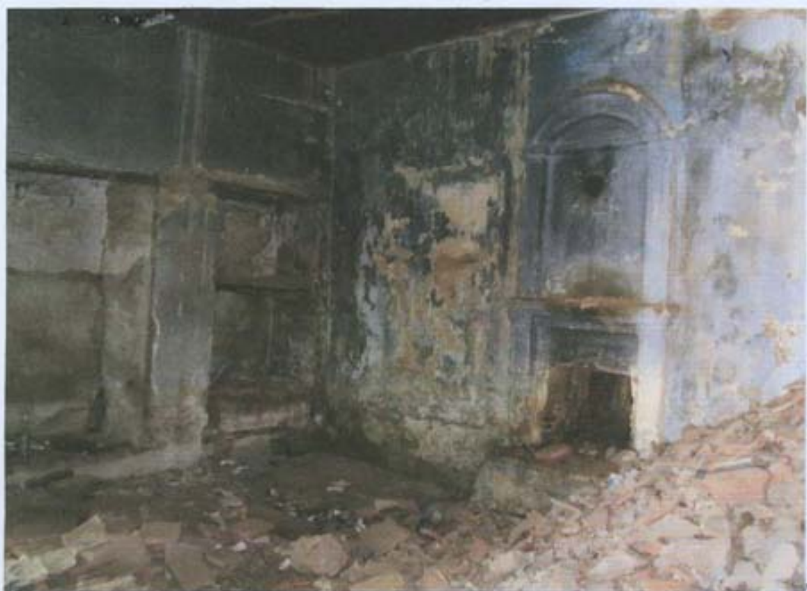
სურ. 15- ბუხრიანი ოთახი შენობის ადრეულ ნაწილში.