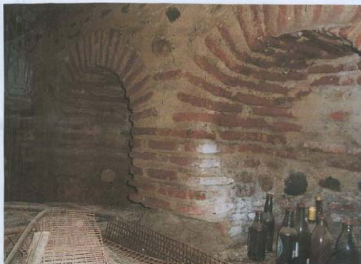
სურ. 40- თაღოვანი ნიშები სარდაფში.