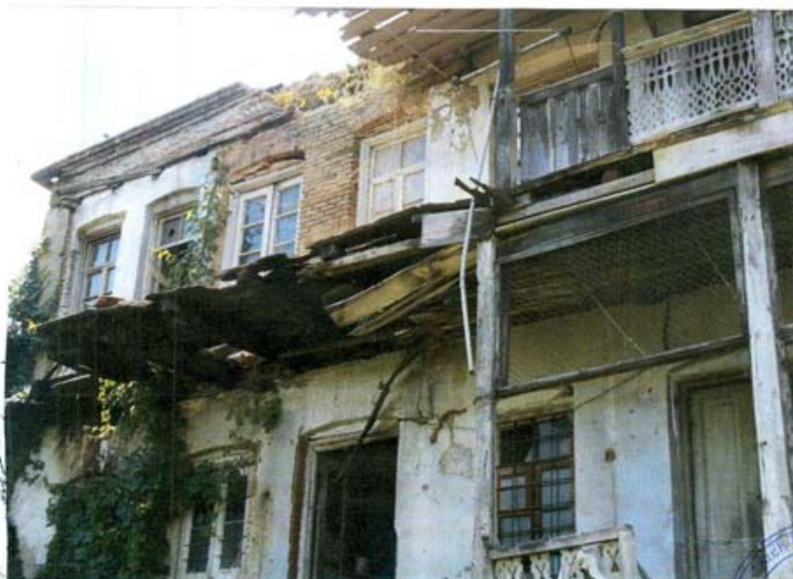
სურ. 26- ჩრდილოეთის ფასადის ფრაგმენტი.