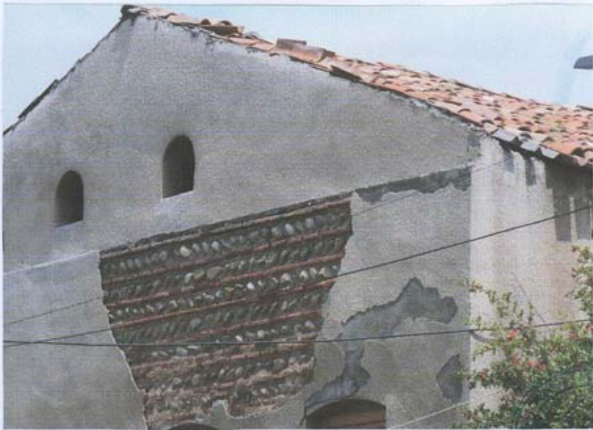
სურ. 6- დასავლეთის ფასადის ფრაგმენტი