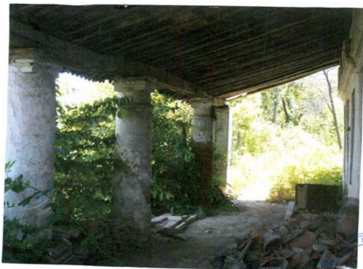
სურ. 14- მრგვალი სვეტების რიგი.