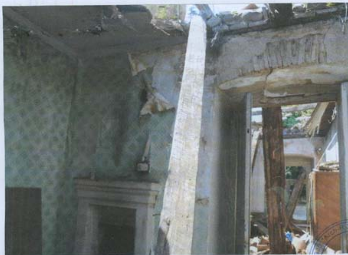
სურ. 34- დაზიანებული ოთახები ნუ-3 სართულზე.