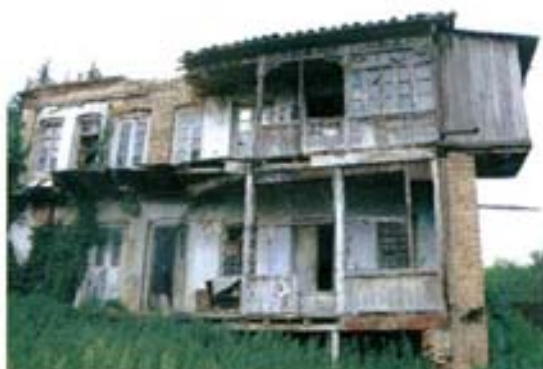
ი. ჭავჭავაძის ქ. №186 ფასადი უნის მხრიდან