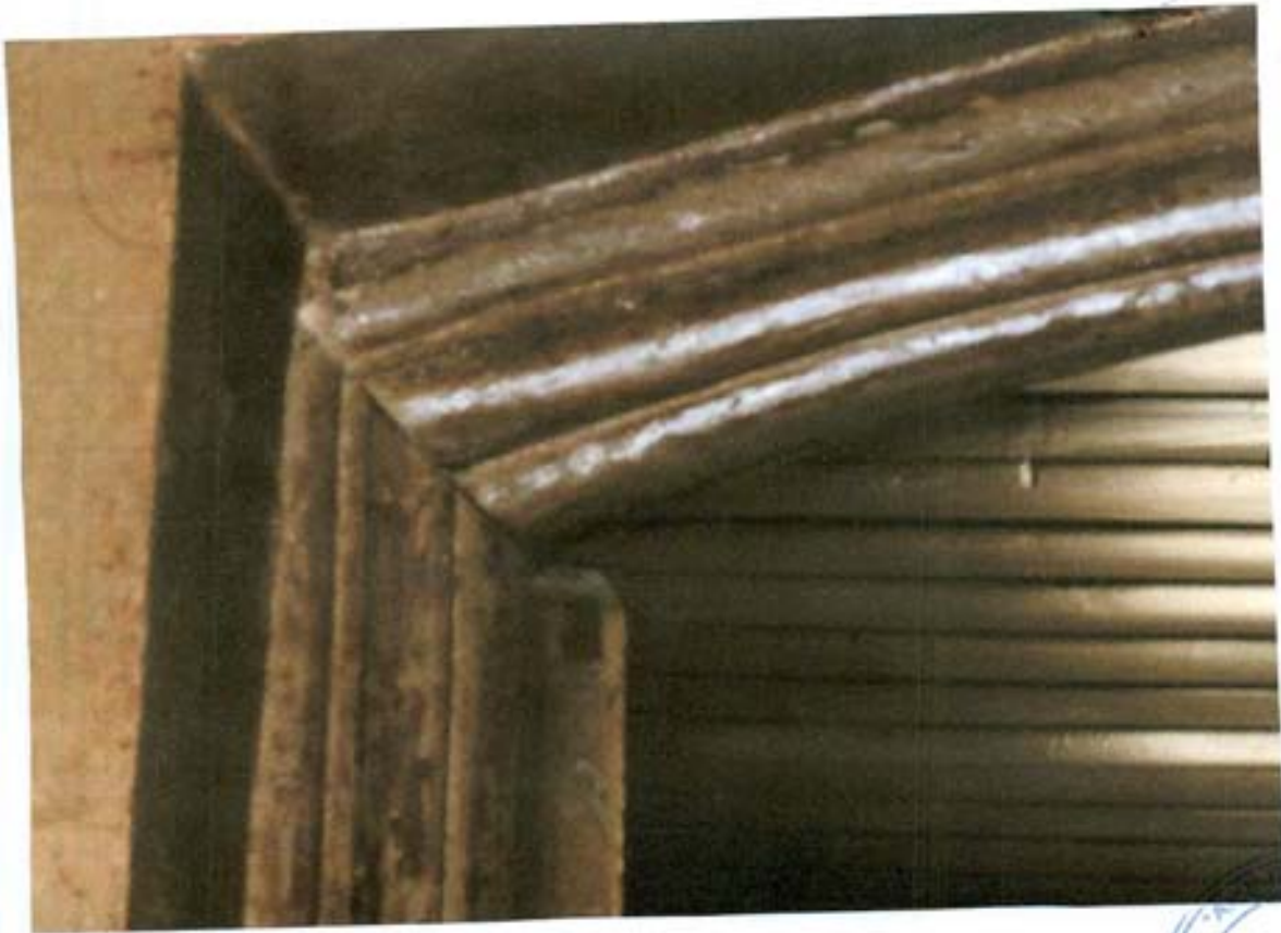
სურ. 36- კარის ჩარჩოს პროფილი.