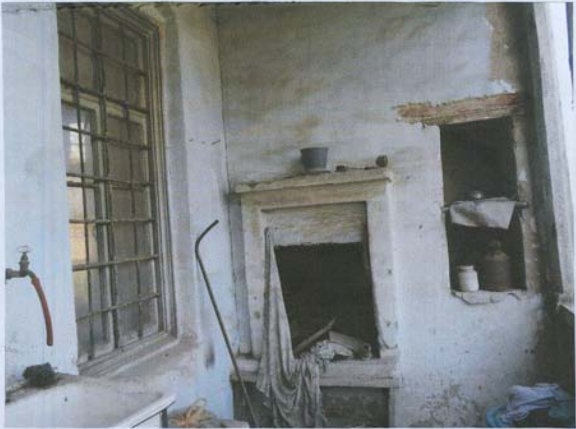
სურ. 31-ბუხარი და ნიშე მუ-2 სარბუღის აივანზე.