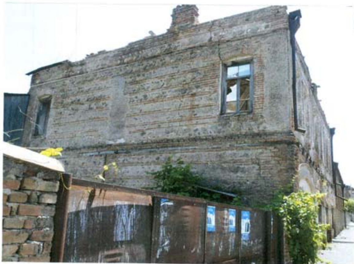
სურ. 25- დასავლეთის ფასადი.