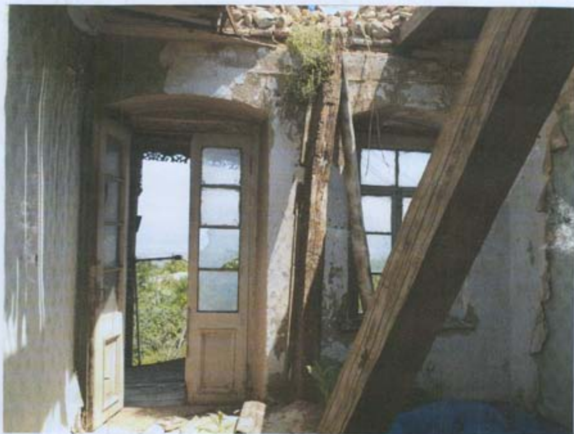
სურ. 33- დაზიანებული ოთახები ნუ-3 სართულზე.