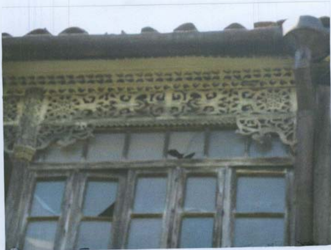
სურ. 29- ჩრდილოეთის სივრცის ზედა დეკორი.