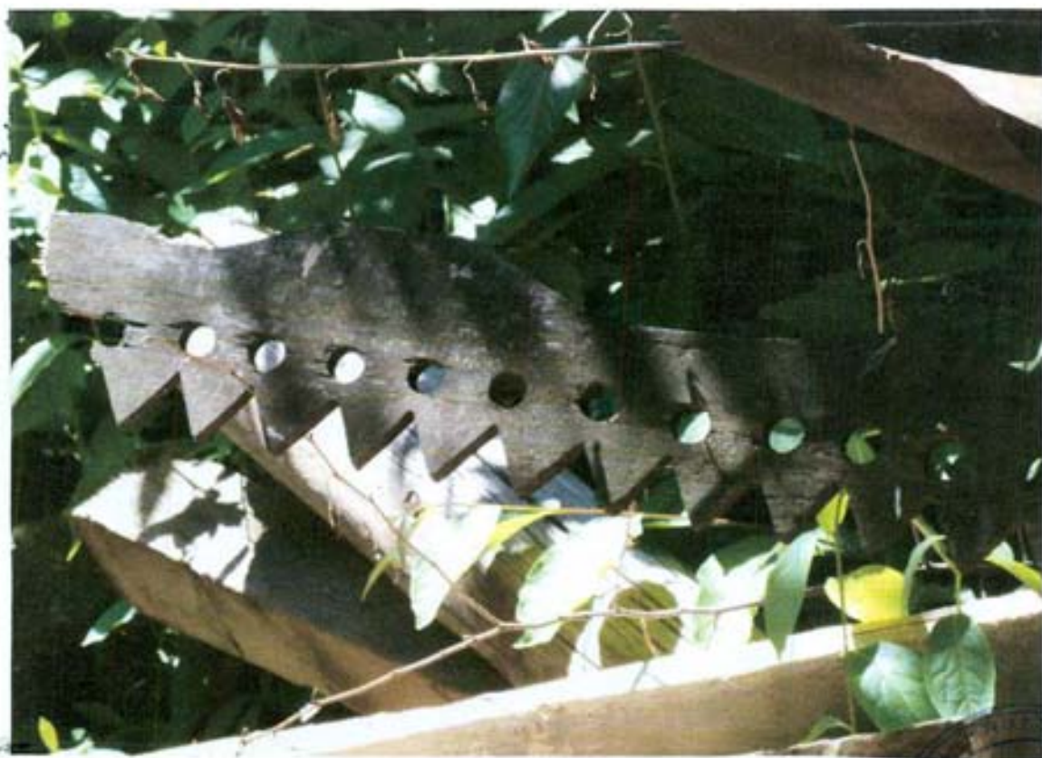
სურ. 18- გვიანდელი ნაწ. აივნის მუზღის ფრაგმენტი.