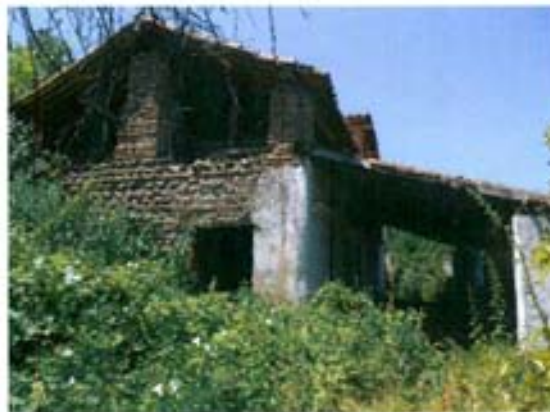
ბ. უჩხოსავის ქ. №20