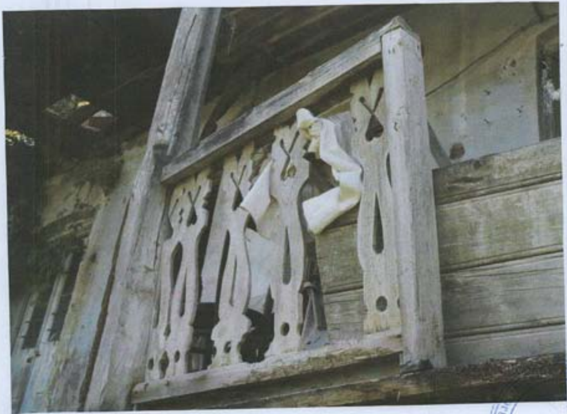
სურ. 32- აივნის მთაჭირის დეკორი მუ-2 სარბუღზე