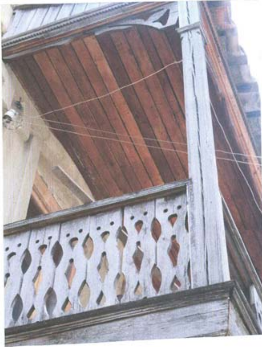
სურ. 7- აივნის ფრამგმუნტი.