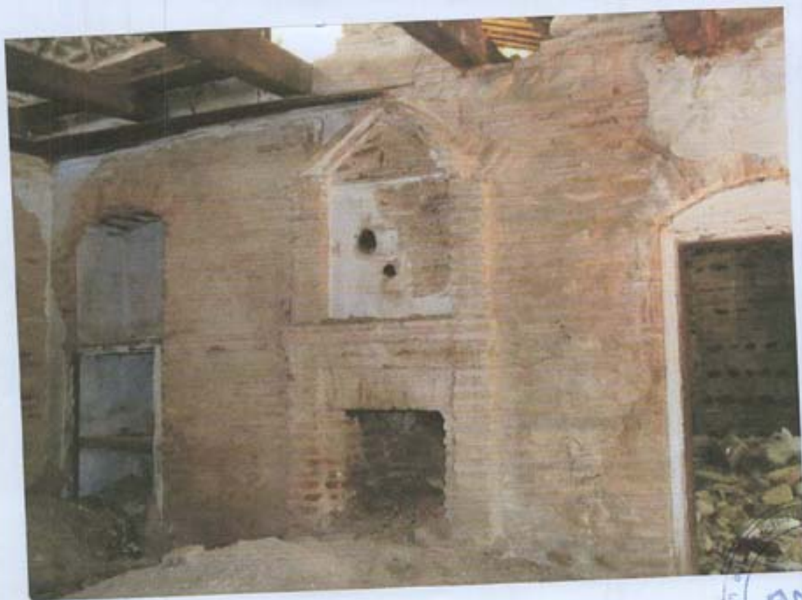
სურ. 22- ბუნრიანი ოთახი გვიანდელ ნაწილში.