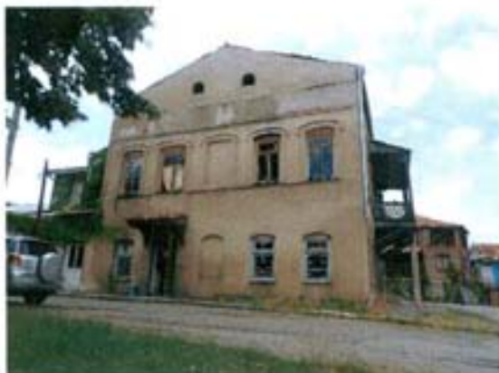
ბ. ცაბაძის ქ. №5