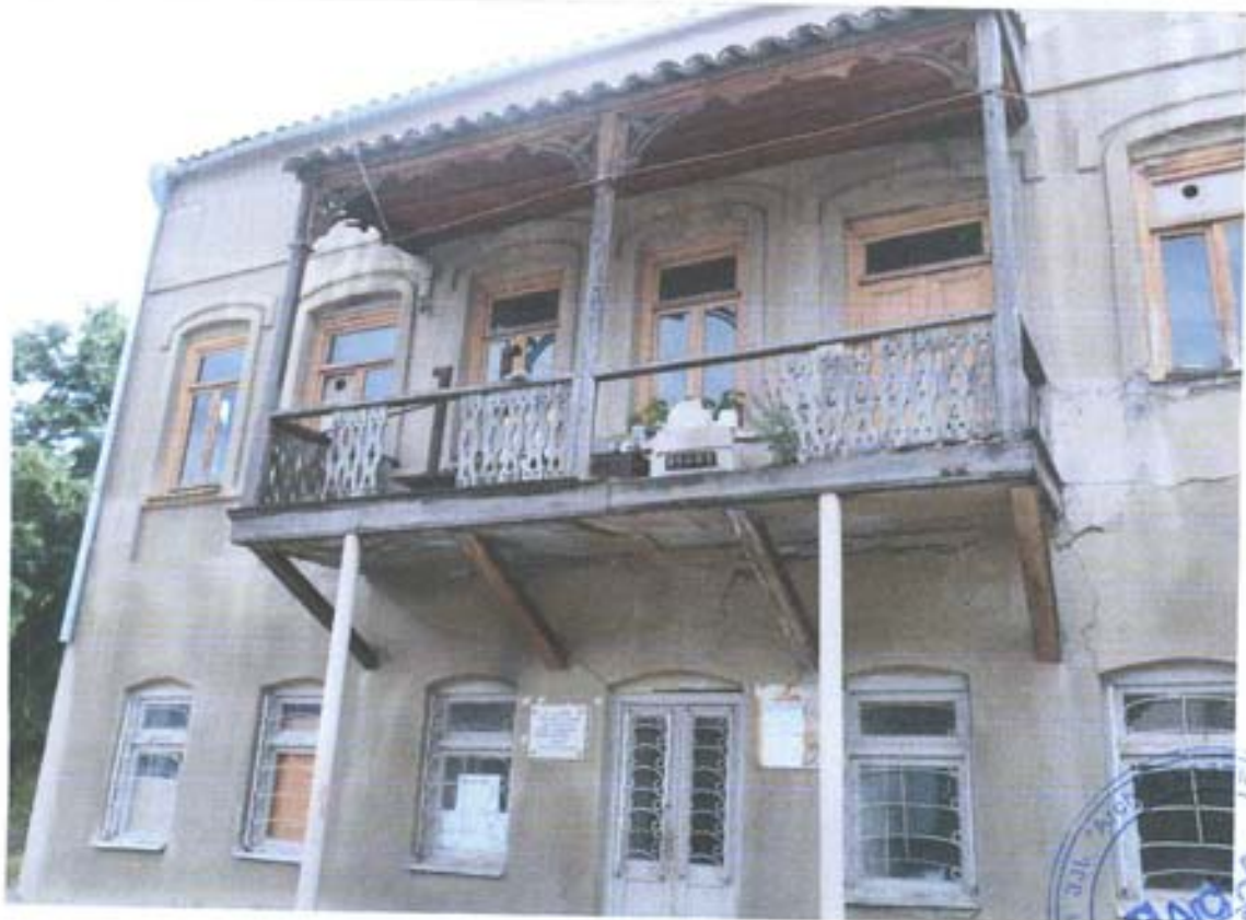
სურ.4- ჩრდილოეთის ფასადი.