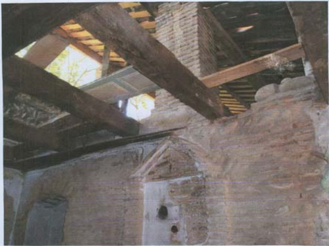
სურ. 21- გადამბურვის კონსტრუქციის ნაწილი.