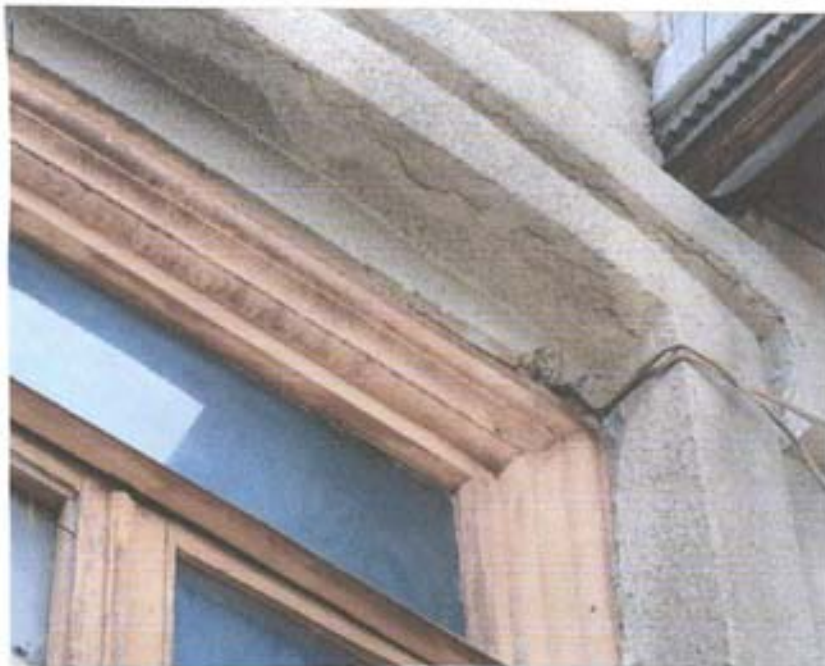
სურ. 8- ფანჯრის ჩარჩოს პროფილი.