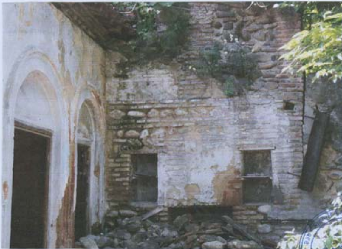
სურ. 12-საბჭუნთი კვლელი აივანის გასწვრივ.