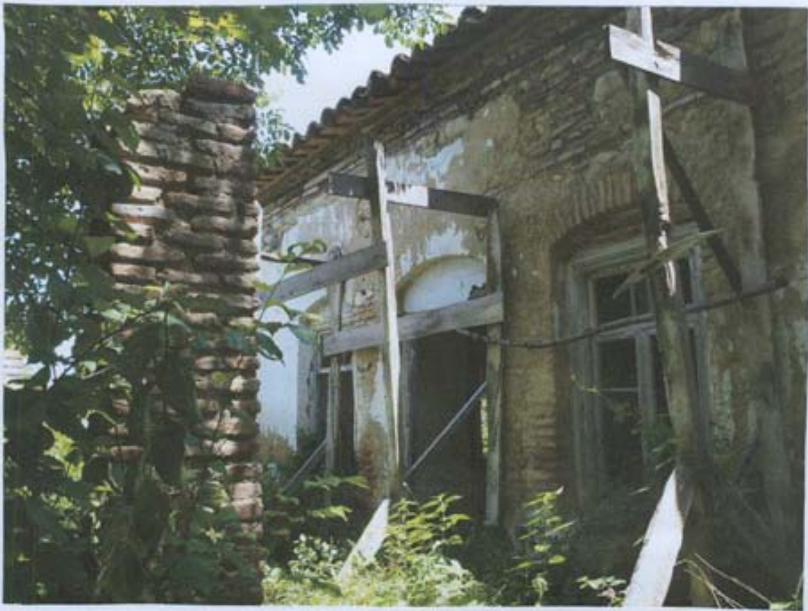
სურ. 11-დასავლეთის ჭასადის ტრავმირენტი.