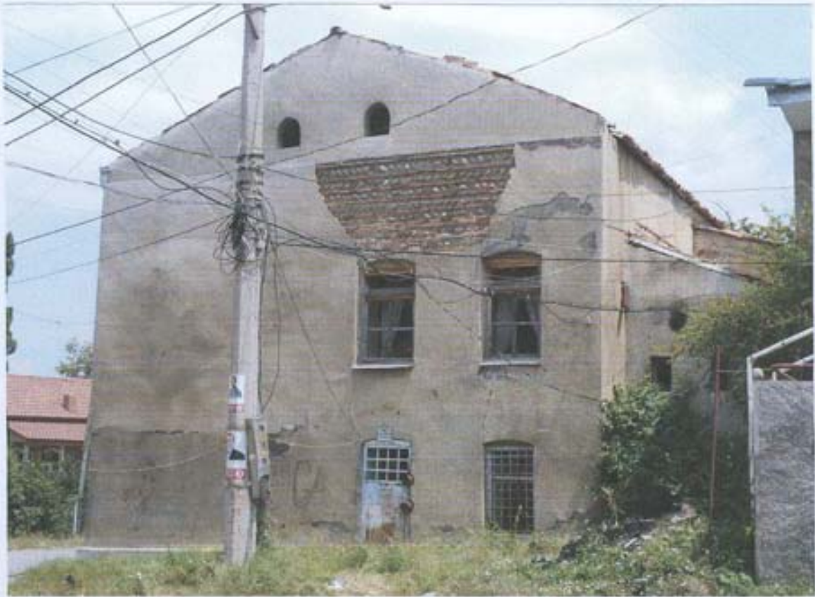
სურ. 5- დასავლეთის ფასადი.