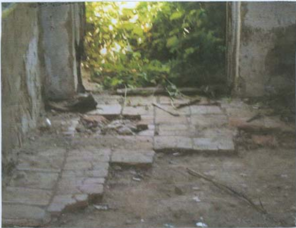
სურ. 19- ქართული აგურის იატაკი ბუბრიან ოთახში.