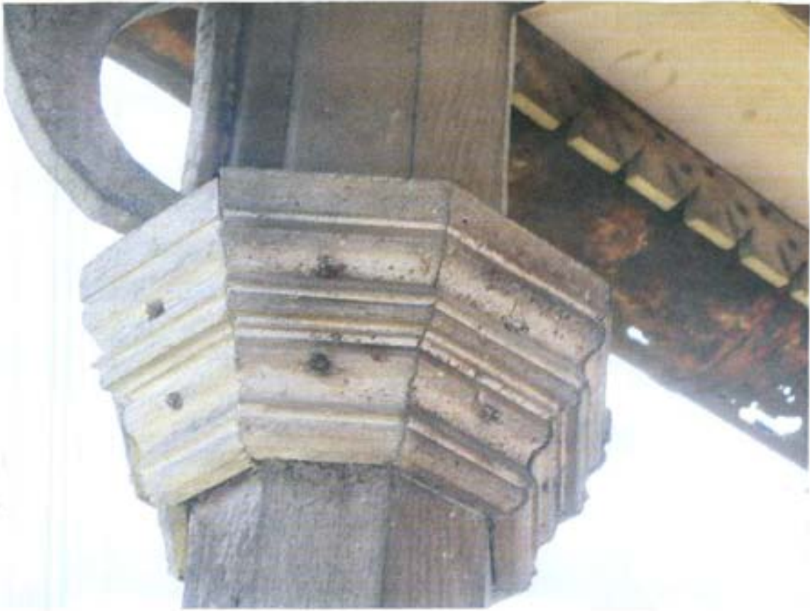
სურ. 35- აივრის სვეტის კაპიტელი.