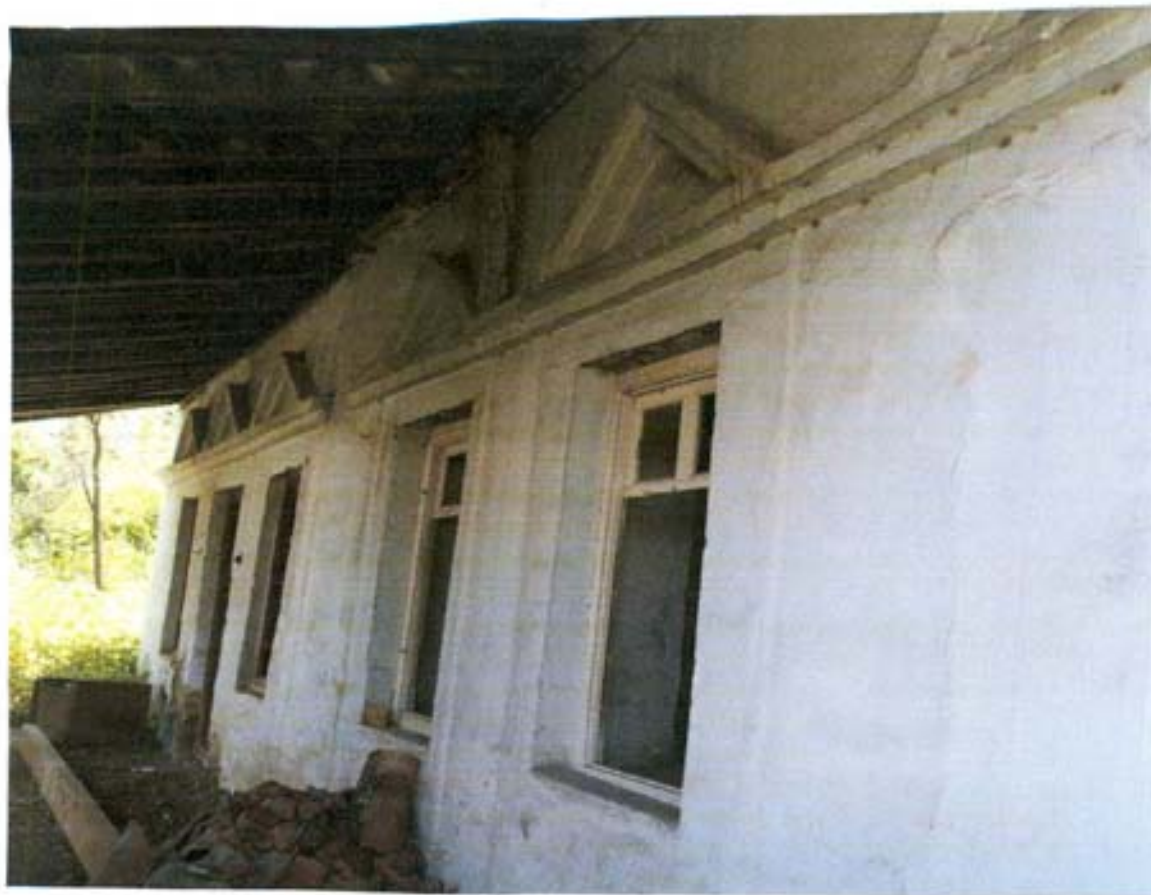
სურ. 13- ჩრდილოეთის კედლის მორაქვობა.