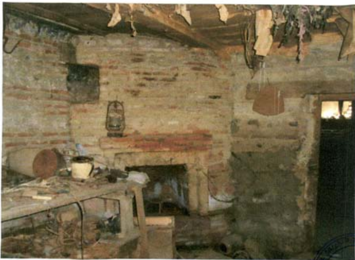
სურ. 38- კუბნის ბუხარი სარდაფში.