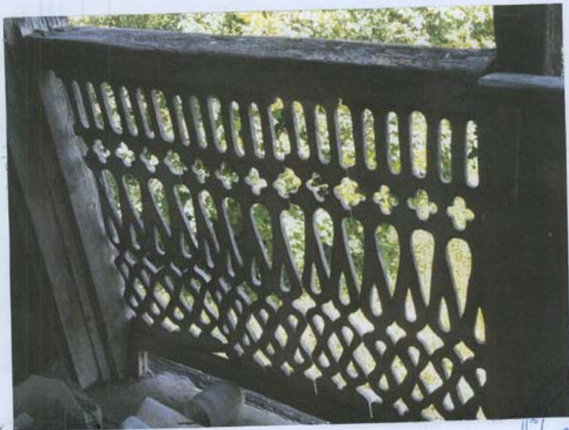
სურ. 30- სივრცის მთავრის დეკორი ნუ-3 სარდალზე.