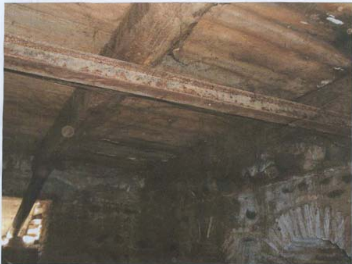
სურ. 39- ჭურის ფრაგმენტი სარდაფის დიდ ოთახში.