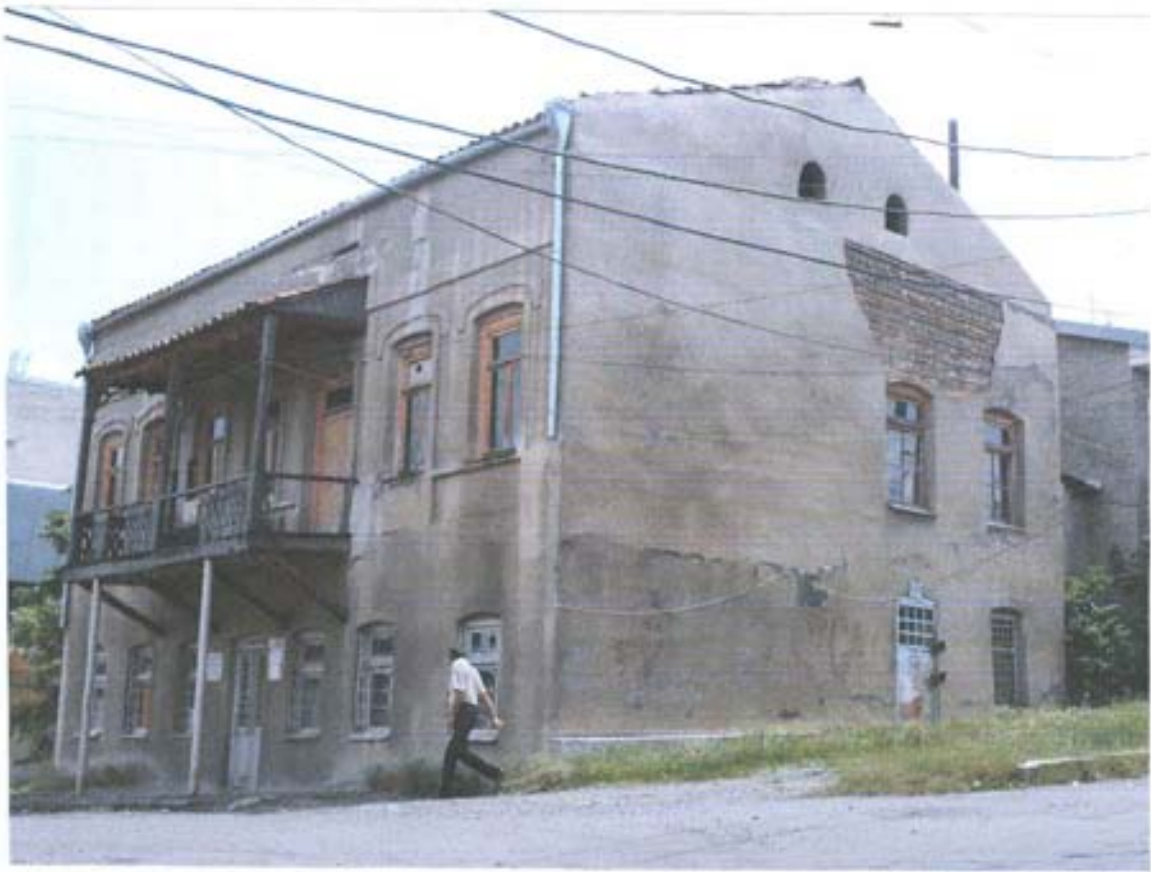
სურ.3- ხედი ჩრდილო- დასავლეთიდან.