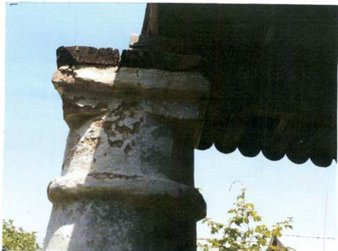
სურ. 17-ნრგვადი სვეტის კაპიტელი.