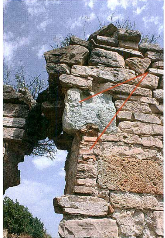
ხედი ჩრდილო დასავლეთიდან