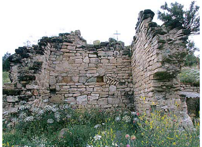
ინტერიერი ხედი აღმოსავლეთიდან