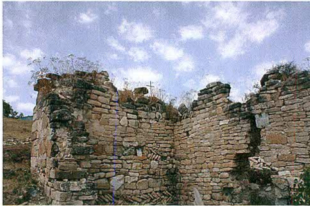
ცრილოეთი კედელი ხედი სამხრეთიდან