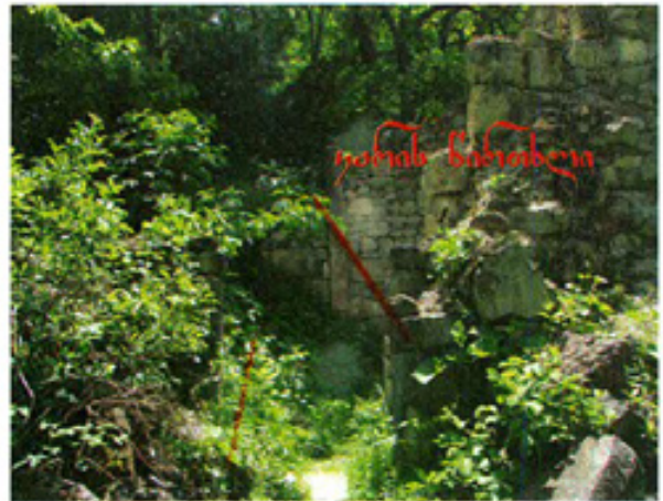
ჩრდილოეთი ფასადის ფრესკა