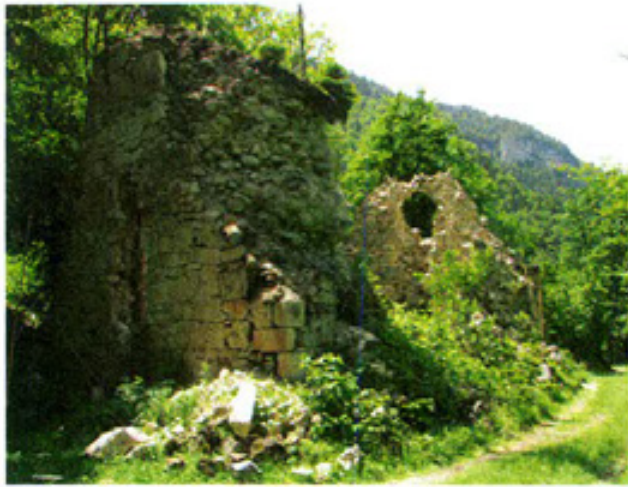
ბედი ცნობ. აღმოსავლეთიდან