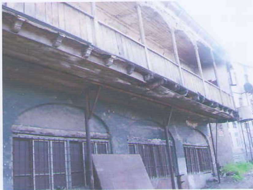
ხედი შიდა ეზოდან (საარქივო მასალა)

ძველის უკანა ფასადის რეაბილიტაციისათვის აუცილებელია მისი სრული კვლევა და საპროექტო სამუშაოების შესრულება, რაც მოგვცემს ამ ფასადის სრული აღდგენის საშუალებას.