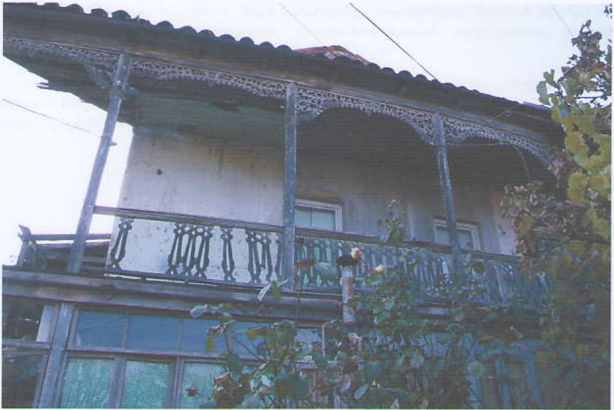
ხედი შიდა ეზოდან (გვერდითა ფასადი)

გაჩენილი. ამიტომ აუცილებელია ნაგებობის საძირკვლის მდგრადობაზე გეოლოგიური კვლევის ჩატარება.