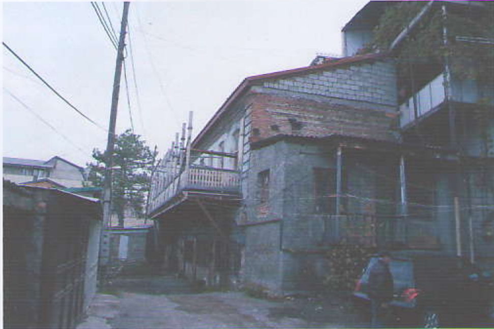
ხედი შიდა ეზოდან

არქიტექტურისათვის შეუსაბამოა. მისი ზომები მნიშვნელოვნად აღემატება რემონტამდე არსებულს. ამ გარემოების გამო აიენის საყრდენი კრონშტეინები რკინის შევლერებით არის შესრულებული, რაც რესტავრაციის მეთოლოგიური პრინციპებიდან გამომდინარე არასასურველია. მითუმეტეს, რომ ნაღესობისაგან განთავისუფლებულ თაღედის წყობაში ჩანს ჩამოხერხილი თავდაპირველი კრონშტეინების კოჭები, ბუდეების განლაგების თავისებური სქემა, რომელთა შესწავლა საშუალებას მისცემს პროექტანტებს, აღადგინოს საყრდენი კონსტრუქცია პირვანდელი სახით თუ არა, პარალელების მეთოდის გამოყენებით – ორიგინალთან მიახლოებით მაინც.