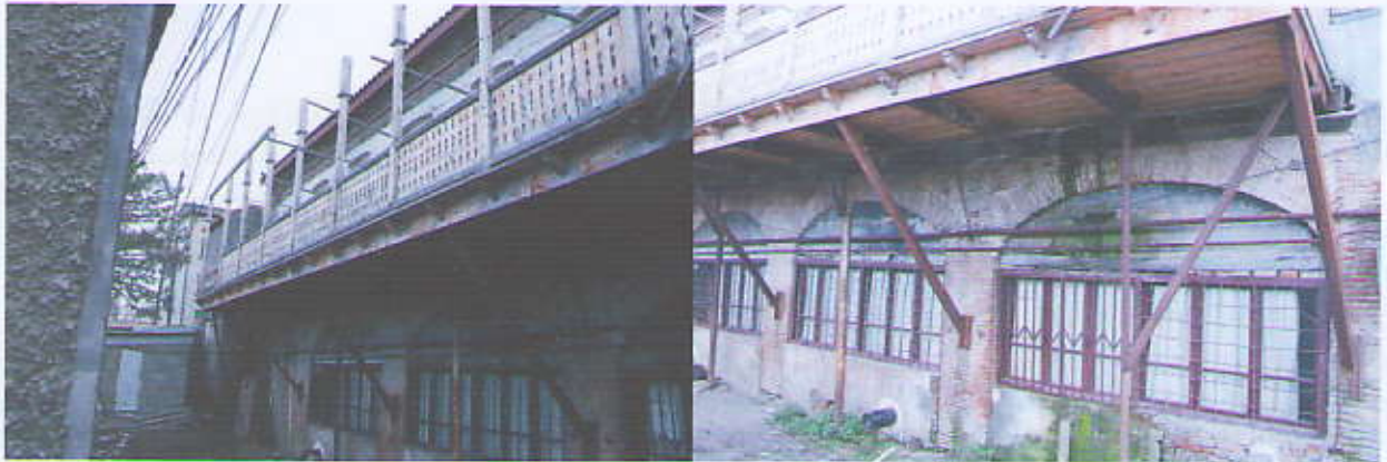
ხედი შიდა ეზოდან

ერეკლე მეორის გამზირის №4 კულტურული მემკვიდრეობის უძრავი ძეგლი თელავის მთავარ გამზირზე მდებარეობს და გარშემორტყმულია ე.წ. “სტალინური პერიოდის” მსხვილი ნაგებობებით. ამ შენობაში მრავალი წელია ფუნქციონირებს თელავის ბავშვთა სამხატვრო სკოლა. ამასთან უკანასკნელ პერიოდში აქვე განთავსდა ლიტერატურული კაფე. რელიეფის თავისებურების გამო შენობა გამზირის მხრიდან ერთსართულიანია, ხოლო უკანა მხრიდან ორსართულიანი. გამზირის მხარეს მიმართული ფასადი მრავალჯერ იქნა შეკეთებული “რესტავრირებული”. ამასთან ძეგლის უკანა მხარე მოუწესრიგებელი დარჩა.