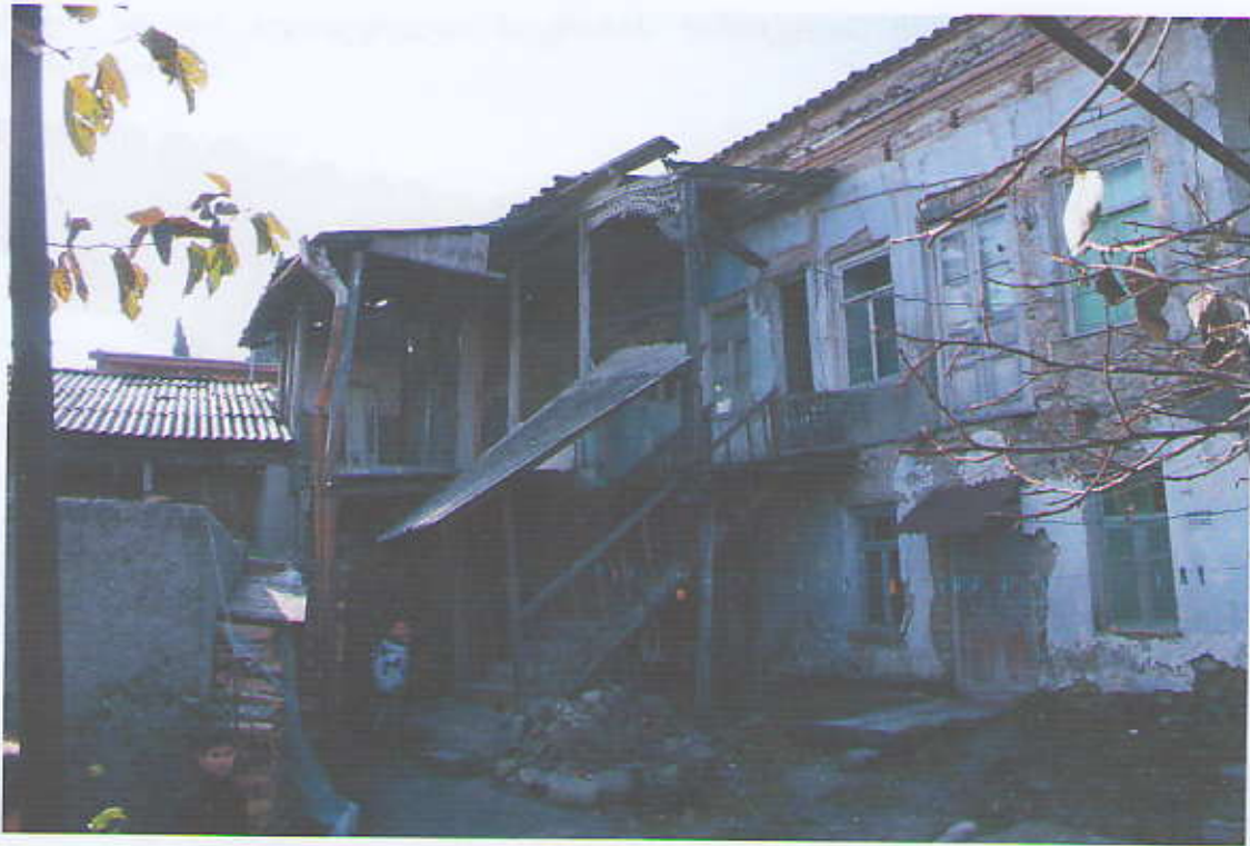
ხედი შიდა ეზოდან

ახელქედიანი №12 კულტურული მემკვიდრეობის უძრავი ძეგლი XIX საუკუნისა დასაწყისისა და XX დასასრულის თელავის ისტორიული განაშენიანების თვალსაჩინო ნიმუშია. სახლი მდებარეობს ქალაქის ერთერთი ღირებული ურბანული მონაკვეთის ეახელქედიანის სახ. ქუჩის დასაწყისში და კარგად იკითხება ქუჩის დათვალიერებისას. სახლის მთავარ მხატვრულ ღირებულებას წარმოადგენს ჭკირული ხის აივანი, რომლის დეკორატიული შემკულობა მაღალი ოსტატობით გამოირჩევა.