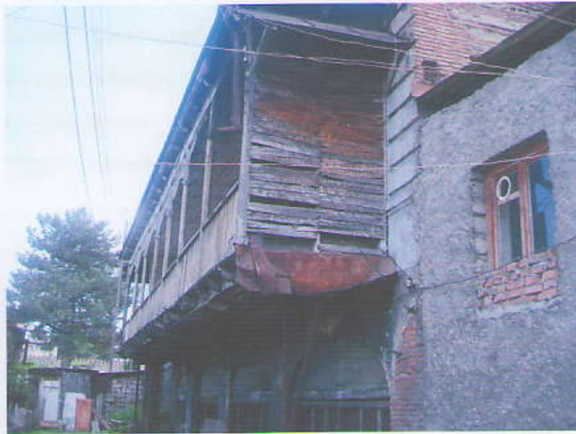
ხედი შიდა ეზოდან (საარქივო მასალა)

შაბლონების დასამზადებლად. წინააღმდეგ შემთხვევაში შაბლონის დამზადება მოხდება საარქივო ფოტომასალის საფუძველზე.