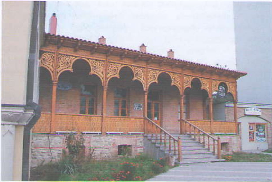
ხედი ერეკლე მეორის გამზირიდან

ერეკლე მეორის გამზირის №4 კულტურული მემკვიდრეობის უძრავი ძეგლი თელავის მთავარ გამზირზე მდებარეობს და გარშემორტყმულია ე.წ. “სტალინური პერიოდის” მსხვილი ნაგებობებით. ამ შენობაში მრავალი წელია ფუნქციონირებს თელავის ბავშვთა სამხატვრო სკოლა. ამასთან უკანასკნელ პერიოდში აქვე განთავსდა ლიტერატურული კაფე. რელიეფის თავისებურების გამო შენობა გამზირის მხრიდან ერთსართულიანია, ხოლო უკანა მხრიდან ორსართულიანი. გამზირის მხარეს მიმართული ფასადი მრავალჯერ იქნა შეკეთებული “რესტავრირებული”. ამასთან ძეგლის უკანა მხარე მოუწესრიგებელი დარჩა.