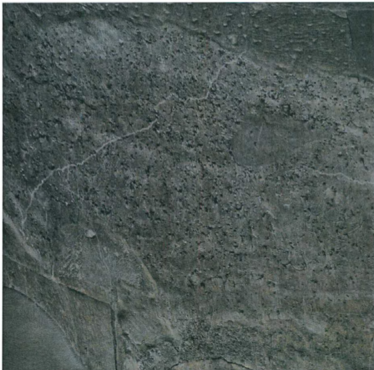
მკვარტლი სურ 8