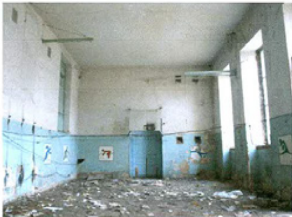
სურ. 11 სპორტ-დარბაზი