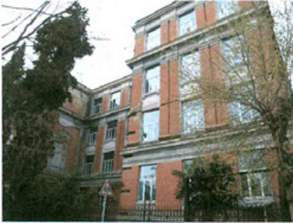
სურ. 1 ფასადი ჩხეიძის ქუჩის მხრიდან