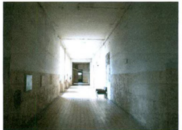
სურ. 12 დერეფანი