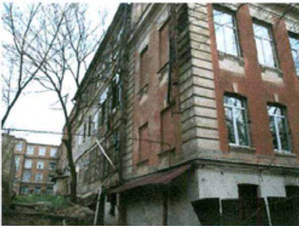
სურ. 5 ფასადის ფრაგმენტი