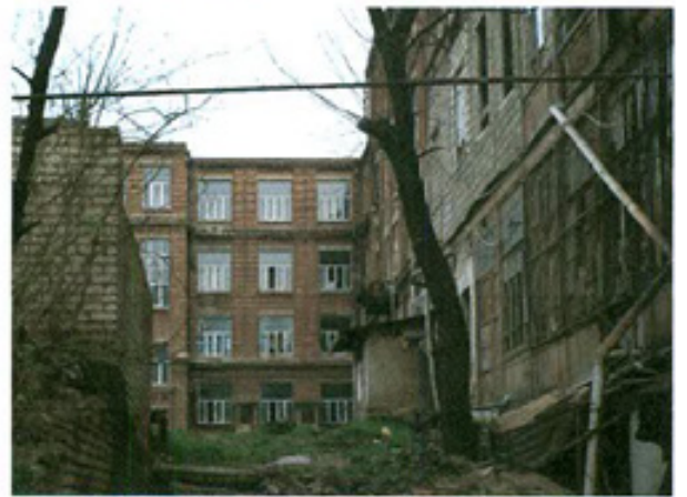
სურ. 6 ფასადი ეზოს მხრიდან