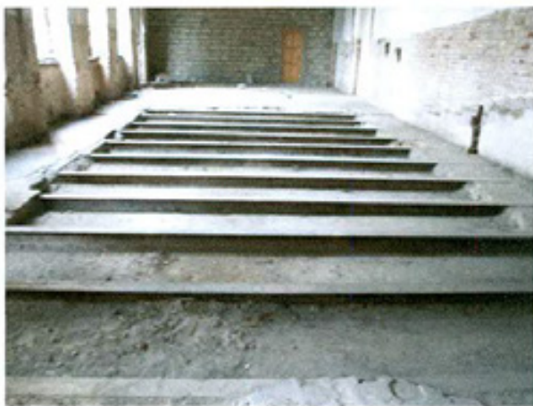
სურ. 13 რკინაბეტონის ჩანართი