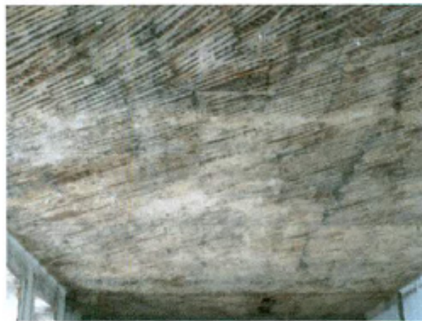
სურ. 14 დაზიანებული ქერი