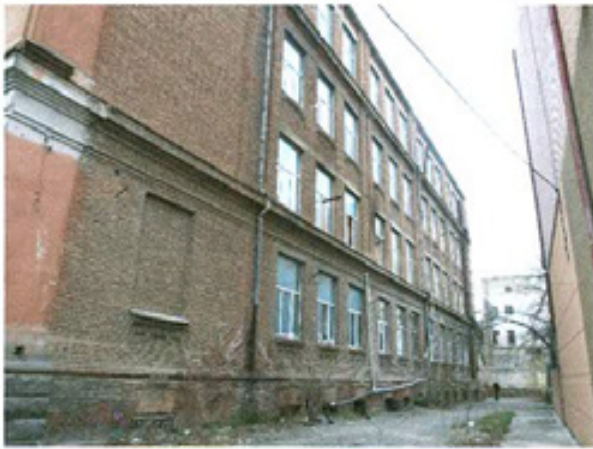
სურ. 3 ფასადი ეზოს მხრიდან