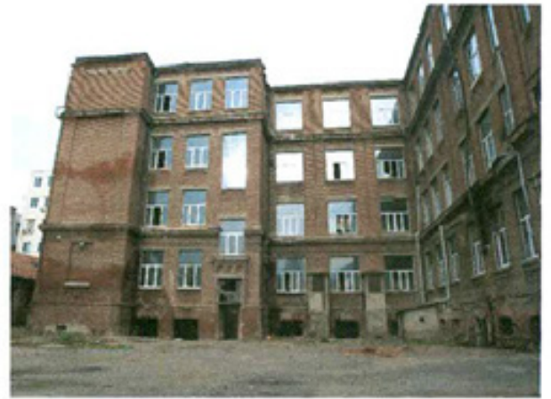
სურ. 4 ფასადი ეზოს მხრიდან