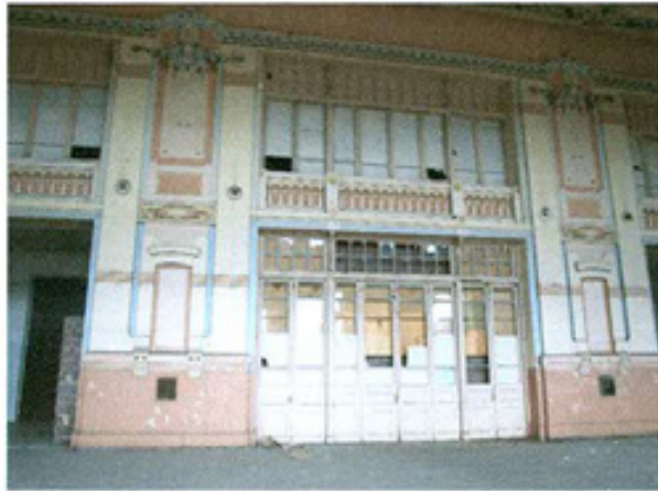
სურ. 9 დარბაზი