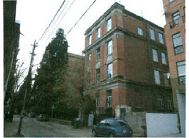
სურ. 2 ფასადი ჩხეიძის ქუჩის მხრიდან