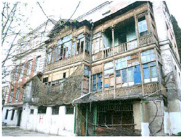
სურ. 7 ფასადი სანაპიროს მხრიდან