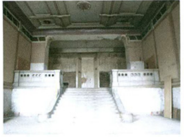
სურ. 8 კოლი