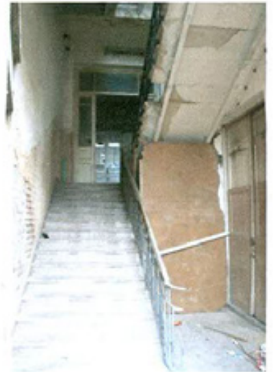
სურ. 10 მეორე სართულის კიბე