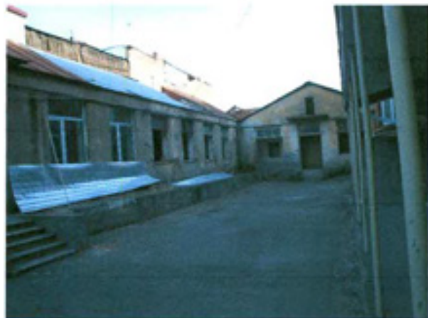
სურ. 12 მინამენი