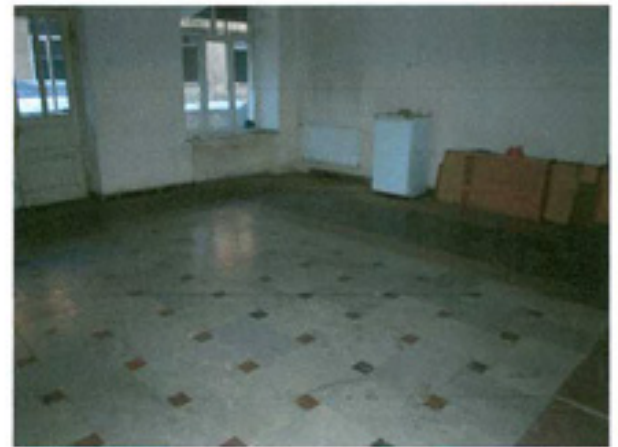
სურ. 22 იატაკის ფრაგმენტი