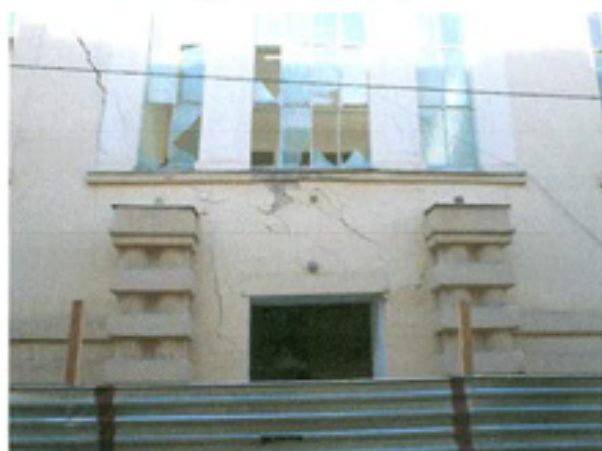
სურ. 6 ფასადის ფრაგმენტი