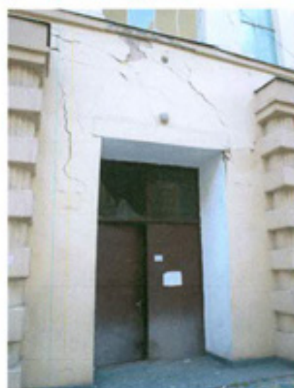
სურ. 10 შესასვლელი კარი