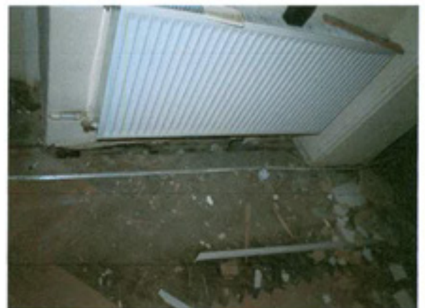
სურ. 24 დაზიანებული იატაკი