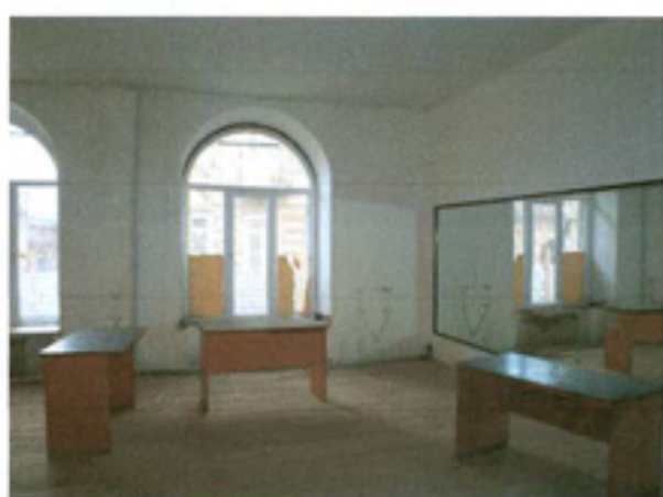
სურ. 18 დარბაზის დეტალი