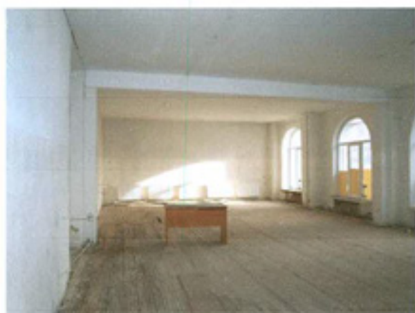
სურ. 15 ინტერიერი