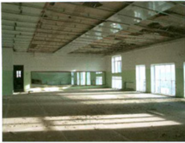
სურ. 19 სადგევავო დარბაზი