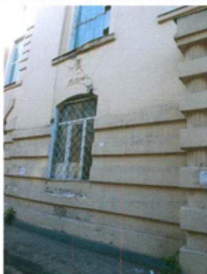
სურ. 9 ფასადის ფრაგმენტი