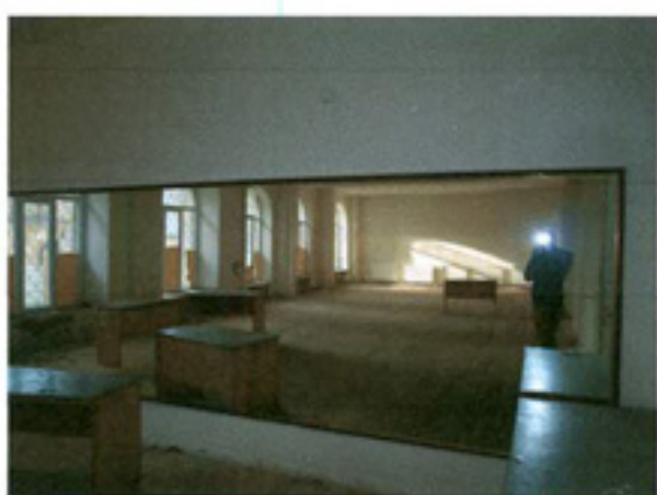
სურ. 17 ინტერიერი, სადგევამ დარბაზი