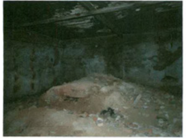
სურ. 26 სარდაფი