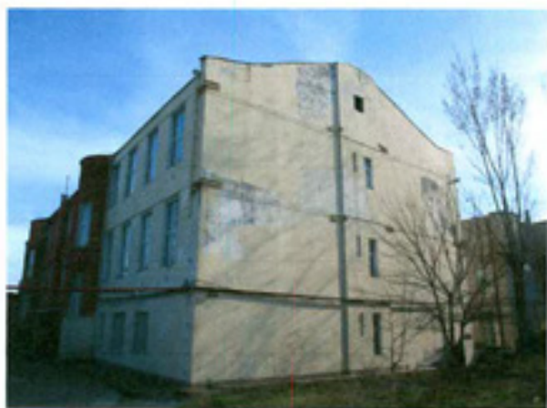
სურ. 11 ფასადი ეზოს მხრიდან