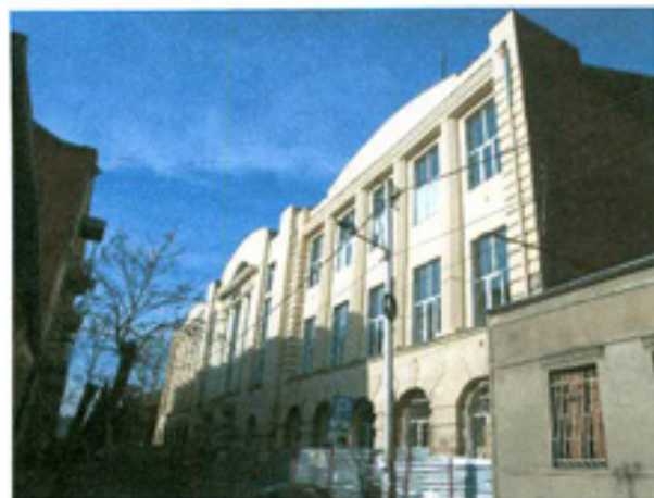
სურ.2 ფასადი ჩუბინაშვილი ქუჩის მხრიდან