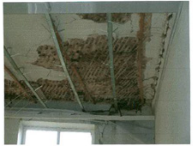
სურ. 20 ჰერის ფრაგმენტი