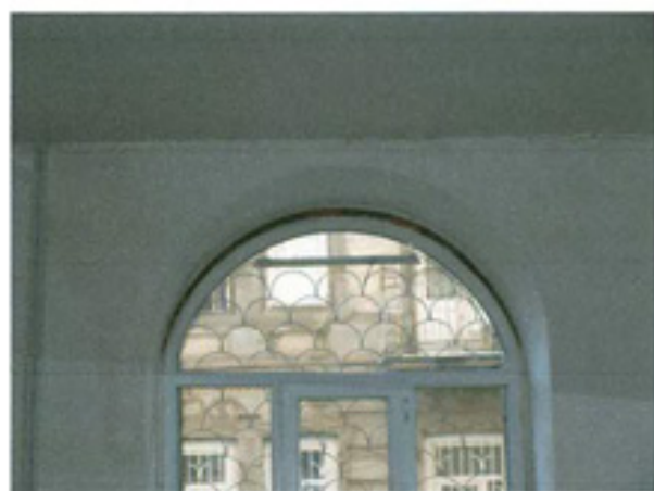
სურ. 16 ინტერიერის დეტალი