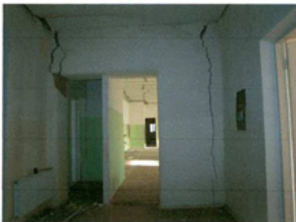
სურ. 23 ინტერიერი, დაზარალებული მზიდი კედელი