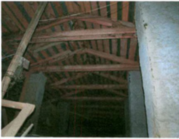
სურ. 25 სხვენის კონსტრუქცია