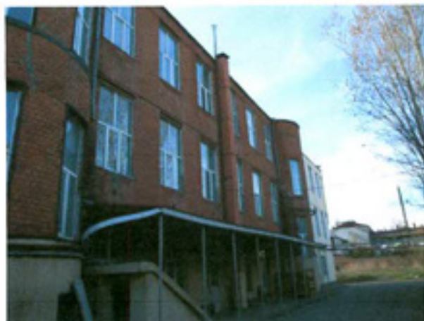
სურ. 14 ფასადი ეზოს მხრიდან