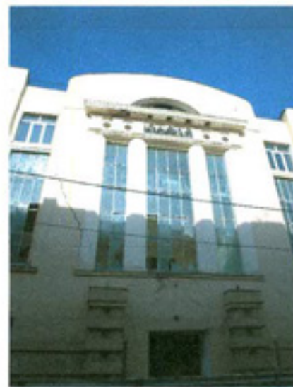
სურ. 4 ფასადის ვიტრაჟი