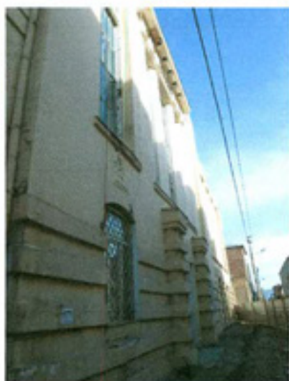
სურ. 3 ფასადის ფრაგმენტი