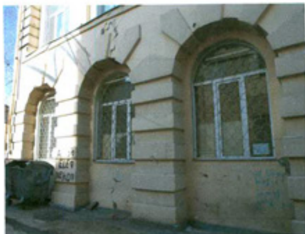
სურ. 8 ფასადის ფრაგმენტი