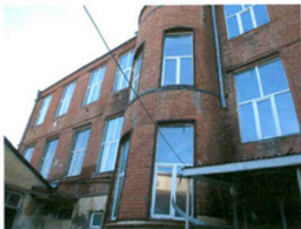
სურ. 13 ფასადი ეზოს მხრიდან