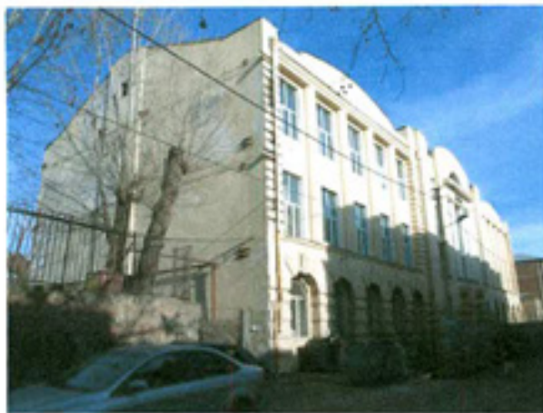
სურ. 1 ფასადი ჩუბინაშვილი ქუჩის მხრიდან