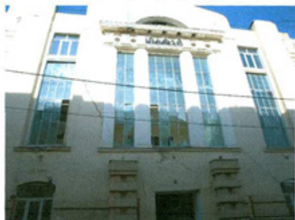
სურ. 5 ფასადის ვიტრაჟი