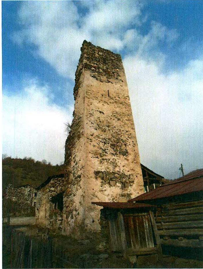
გოგი ცალანის კოშკი