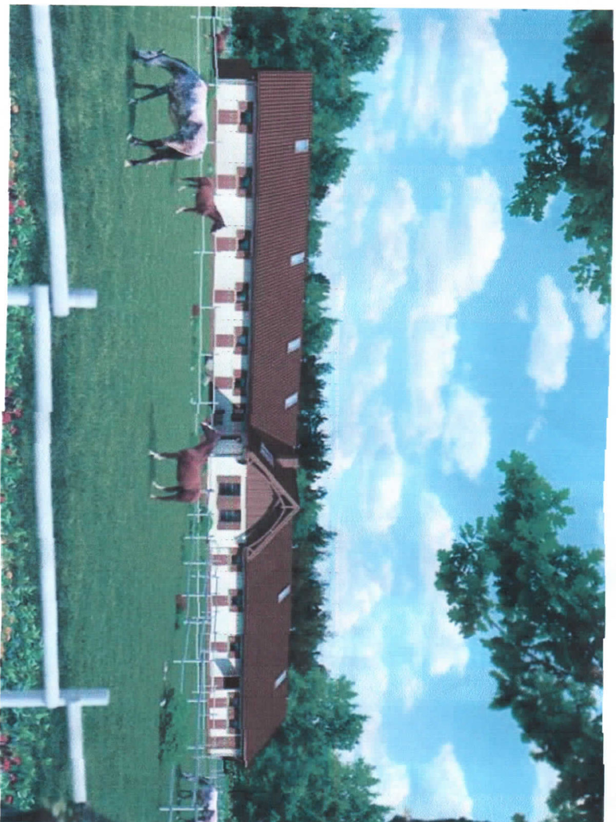
2. თაველა ადგილობრივი ჯიშის ცხენებისათვის