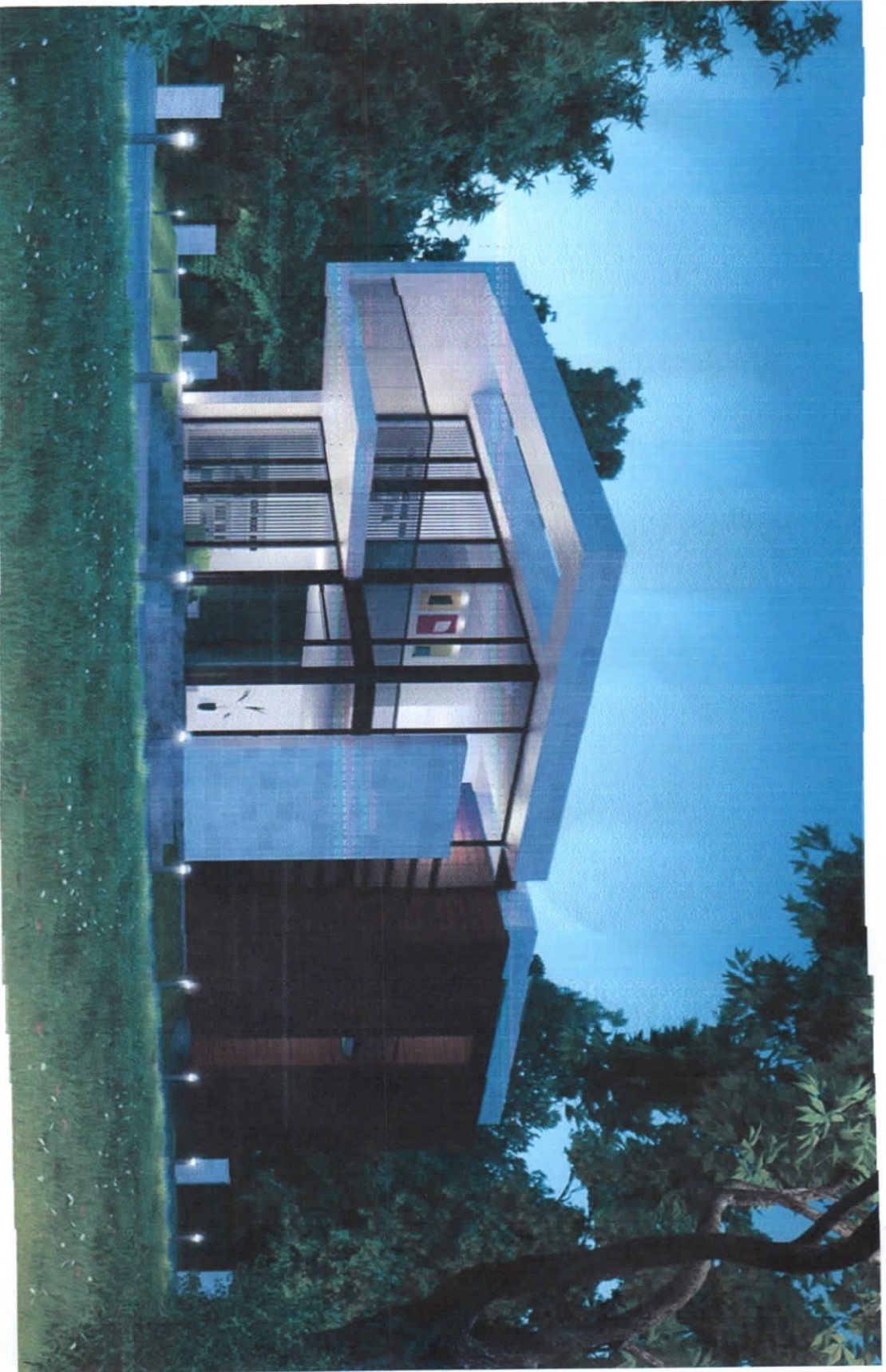
5. საოფისო შენობა