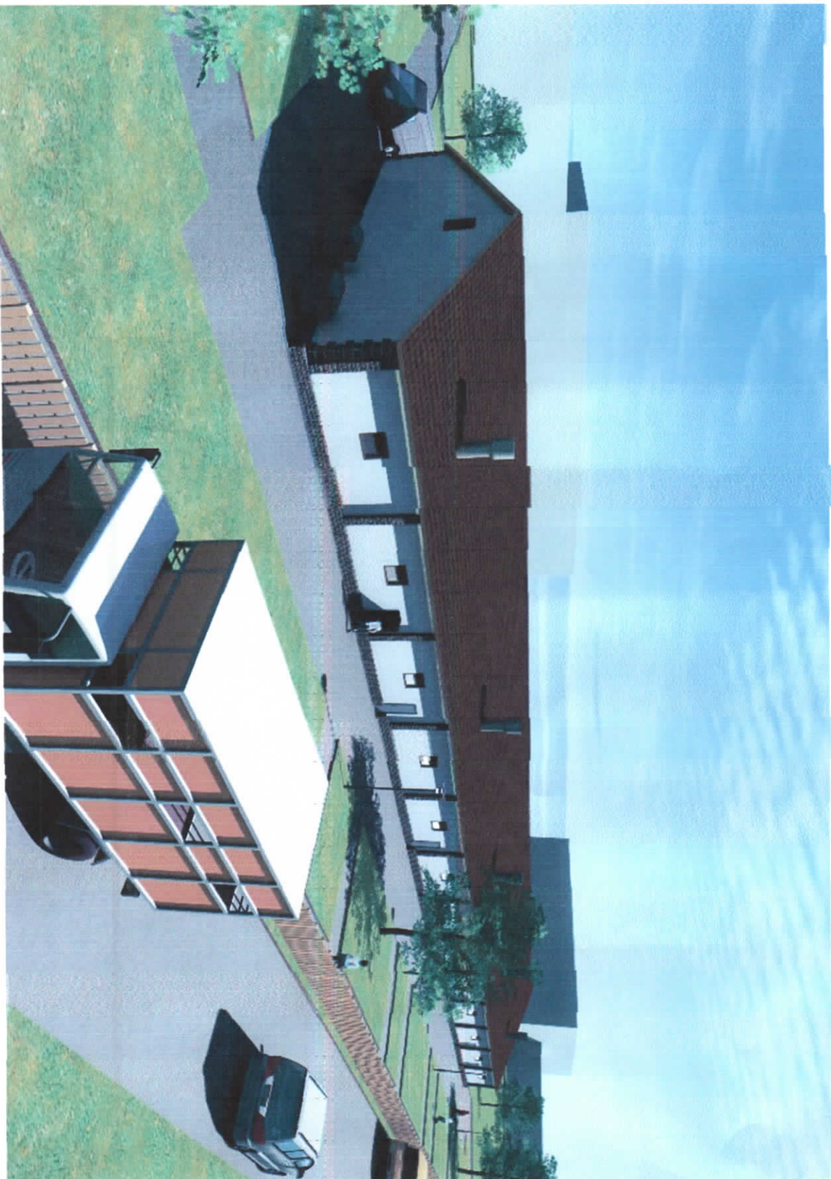
3. მეფრინველეულობის ფერმა