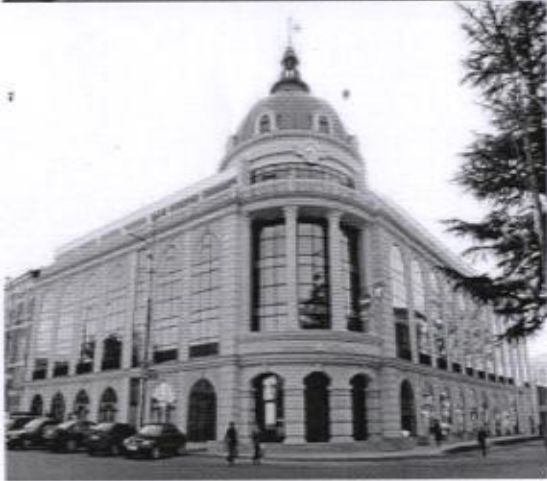
დრამატული თეატრი ქალაქ თელავში ბათუმის მუსიკალური თეატრი, ქუთაისის მესხიშვილის თეატრი, ქუთაისის ოპერა, თბილის სახელმწიფო უნივერსიტეტის პირველი კორპუსი.