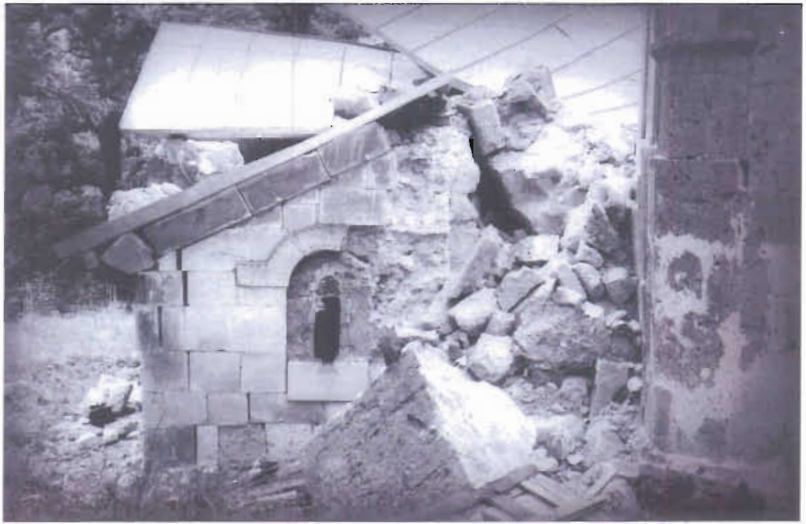
ზემო კრიხის ტაძარი, აღმოსავლეთი ფასადი მიწისძვრის შემდეგ და დღეს