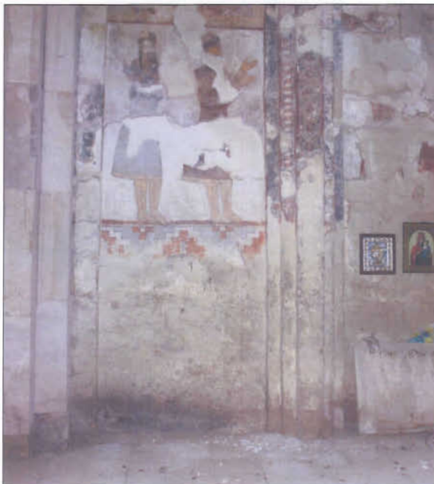
ჩრდილოეთი კედლის მხატვრობის დაზიანება, 2011 წლის ზაფხული