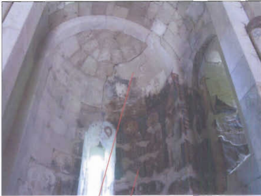
ზემო კრიხის ტაძრის საკურთხეველის მხატვრობის დაზიანება, 2011 წ.