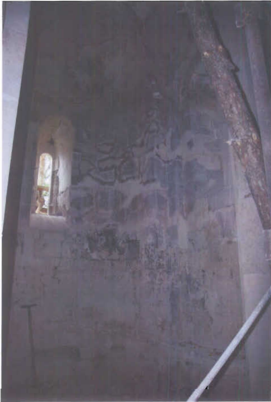
ზემო კრიხის ტაძრის საკურთხეველის მხატვრობის მდგომარეობა, 2008 წ