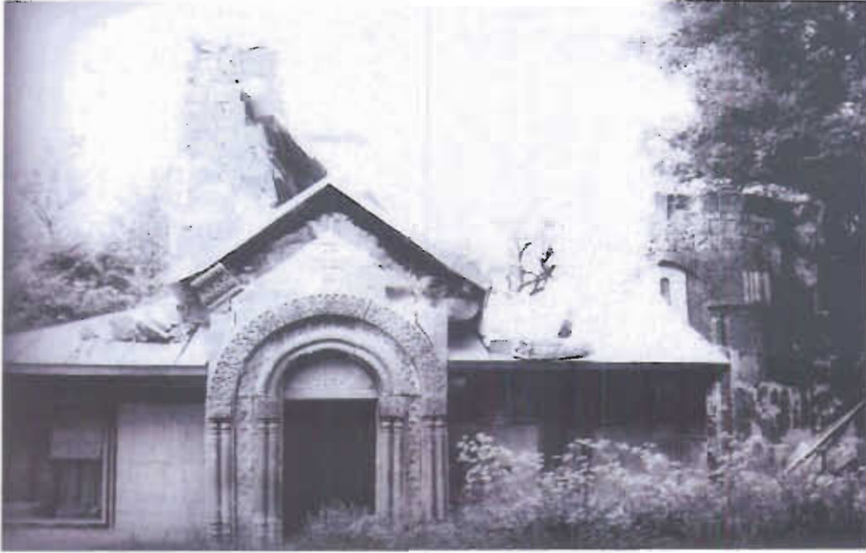
ზემოკრიხის ტაძრის სამხრეთი ფასადი მიწისძვირის შემდეგ და დღეს