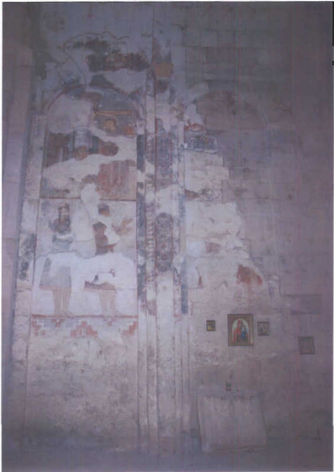
ზემო კრიხის ტაძარი, ჩრდილოეთი კედელი, 2010