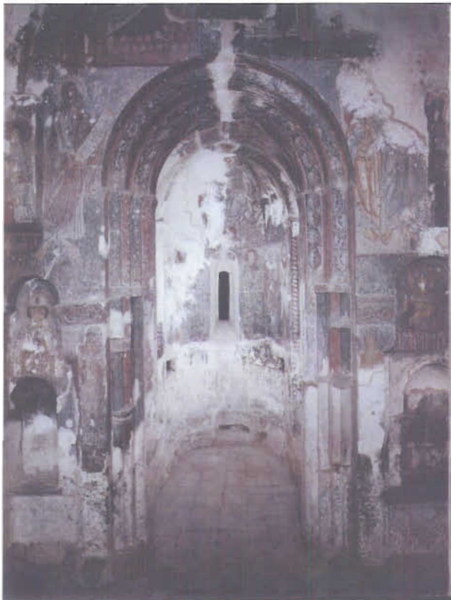
ზემო კრიხის ტაძარი, ხედი საკურთხევისკენ 1991 წლის მიწისძვრამდე

ზემო კრიხის მთავარანგელოზთა ეკლესია, საქართველოს კულტურული მემკვიდრეობის ერთ-ერთი უმნიშვნელოვანესი ძეგლი, XI საუკუნის უნიკალური მოხატულობითაა განსაკუთრებით ცნობილი. როგორც ცნობილია, X საუკუნის მეორე ნახევრის ტაძრის ინტერიერის აღმოსავლეთი მონაკვეთები თავდაპირველად აგებისთანავე მოიხატა; 1050-იან წლებში დასავლეთ ნართექსის დამატებასთან ერთად, ინტერიერი ხელმეორედ შეიმკო სრული მოხატულობით, რომელიც ნაწილობრივ XIII-XIV საუკუნეში განახლდა.