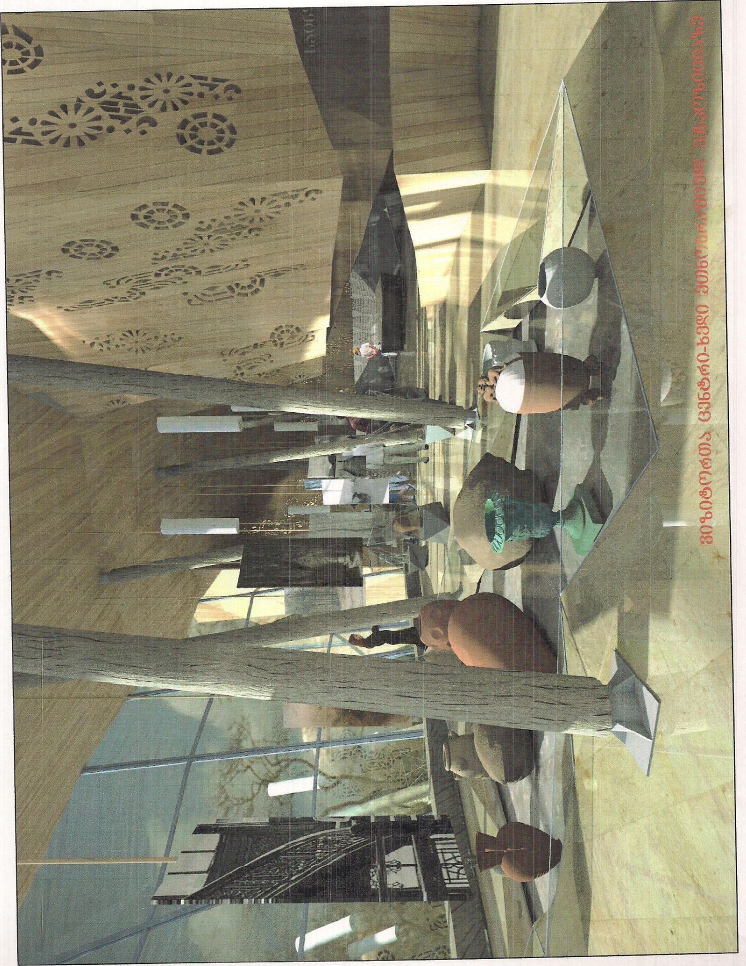
30% ഉറപ്പുള്ള വിലയിൽ വിൽപന നടത്തുന്നതിനായി