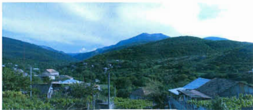
ხედი ღარბაჯის ბანიდან. კავთურის სეოლა (გზა მაღალაანთ და ჭვათახევის ეკლესიებსკენ)