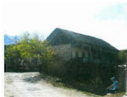
ღარბაჯის მიმდებარე უბანი