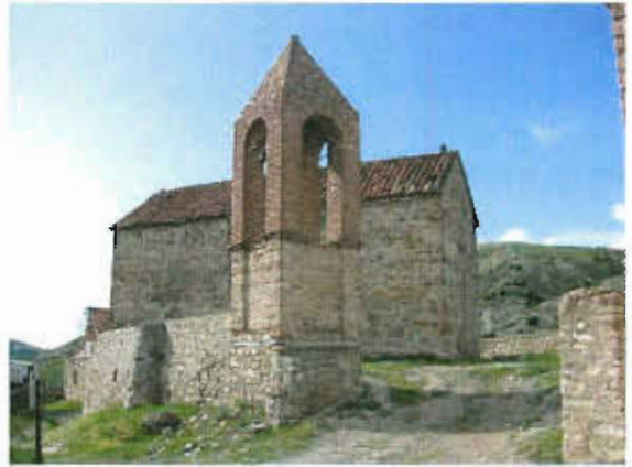
ეკლესია (ხედი ღარბაჯის ბანიდან)