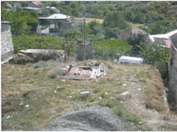
ღარბაჯის გადსურვა (ხედი ეკლესიიდან)