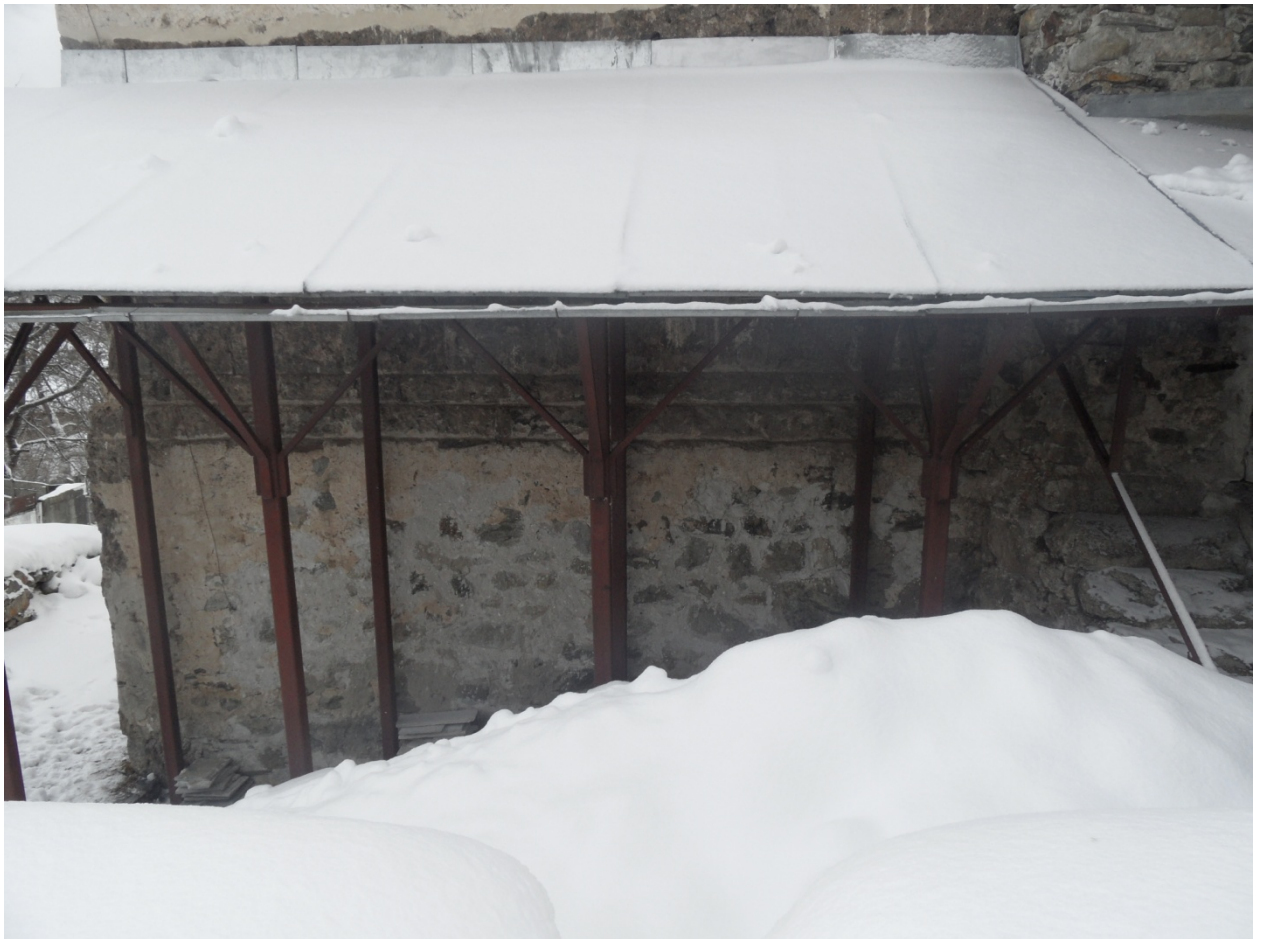
ჩრდ. ფასადი თუნუქის გადახურვა

არქიტექტურაზე ძირეული ჩარევა განხორციელდა 2001-2003წწ-ში (არქ. თ. ნემსაძე) რესტავრაციის მოეწყო მინაშენის ჩრდილოეთი კომპარტიმენტის ჩამოქცეული გადახურვა, მინაშენშივე დაიგო იატაკი. ჩრდილოეთ ფასადის გასწვრივ რკინის კვადრატული მილებზე გაკეთდა თუნუქის გადახურვა, მის ქვეშ კი მოეწყო ბილიკი და კიბე. ჩრდილოეთ მხარეს მიწის მოჭრით, ბილიკის გაკეთებითა და რკინის კონსტრუქციის ქანობით პროექტის ავტორებმა სცადეს გაფართოებული ქვაბულის დაცვა ატმოსფერული ნალექებისგან.