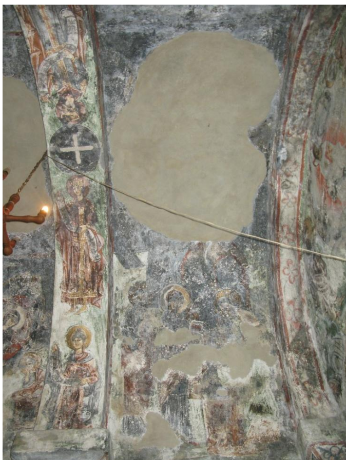
8. სამხრეთ კედელი