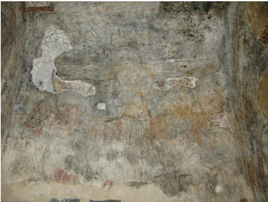
13. პირველი სართული. ზედა ფენის მხატვრობა. ჩრდილოეთ კედელი. მოჩანს ქვედა ფენის მხატვრობა