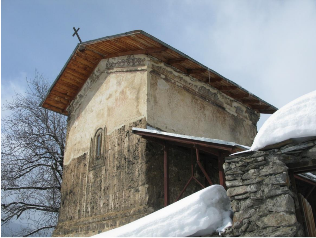
10. აღმოსავლეთ და ჩრდილოეთ ფასადები