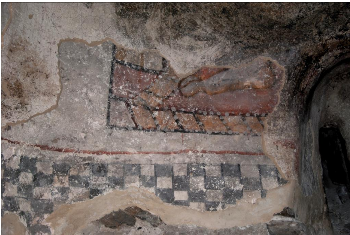
17. პირველი ფენის მხატვრობის ფრაგმენტი. კონქი.