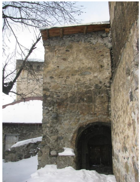
20. დასავლეთ მინაშენის სამხრეთ ნაწილი