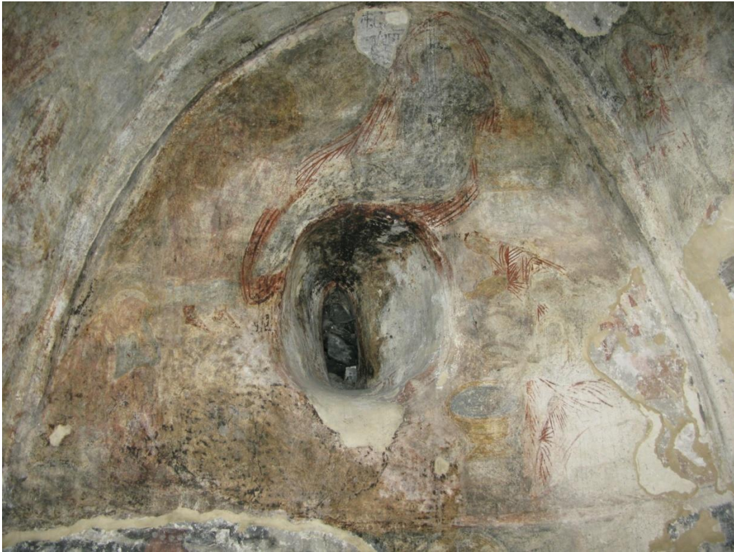
14. პირველი სართული. დასავლეთ კედელი. ზედა ფენის მხატვრობა და მოჩანს ქვედა ფენის მხატვრობა