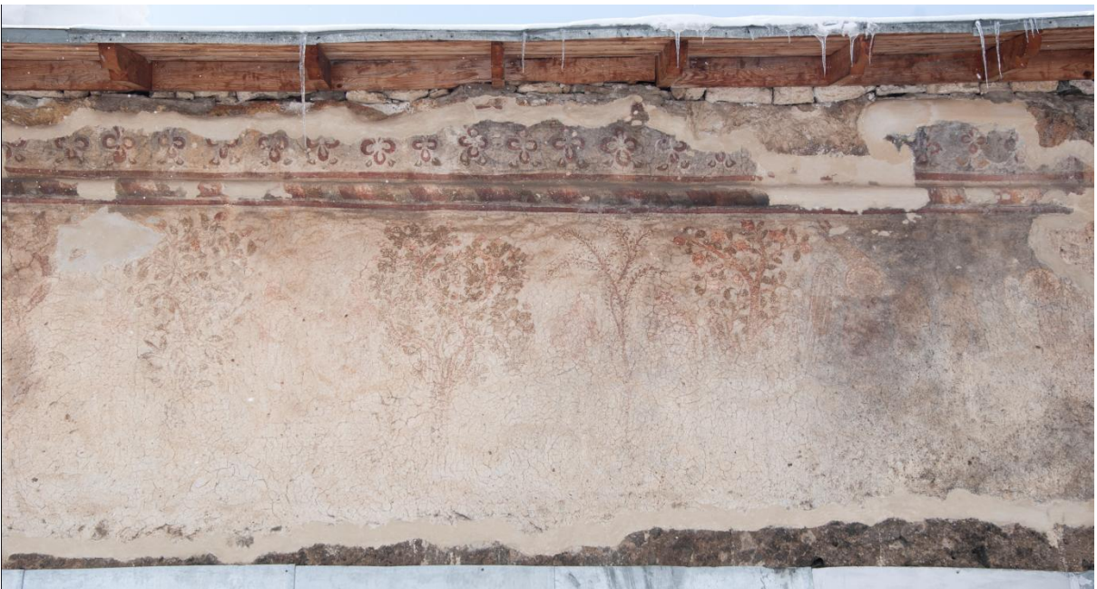
11. ჩრდილოეთის ფასადის მოხატულობა