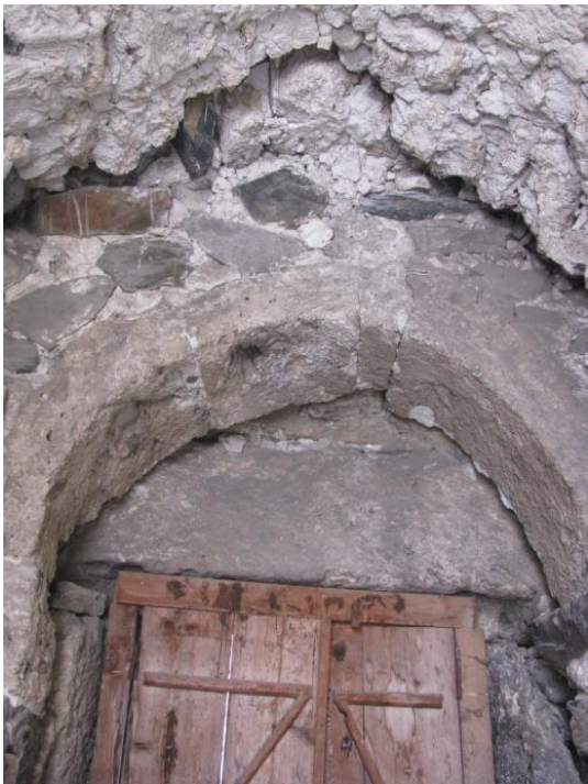
ეკლესიაში შესასვლელი კარი