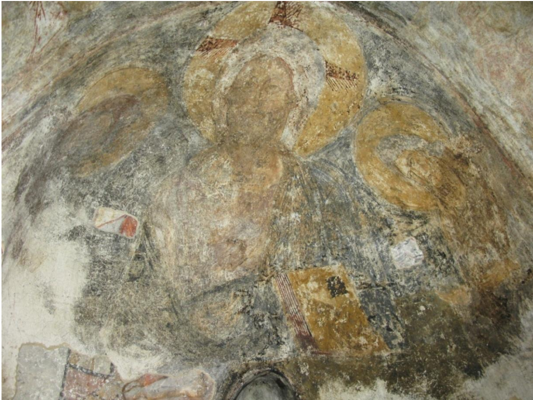
12. პირველი სართულის ზედა ფენის მოხატულობა. კონქი. მოჩანს ქვედა ფენის მხატვრობა