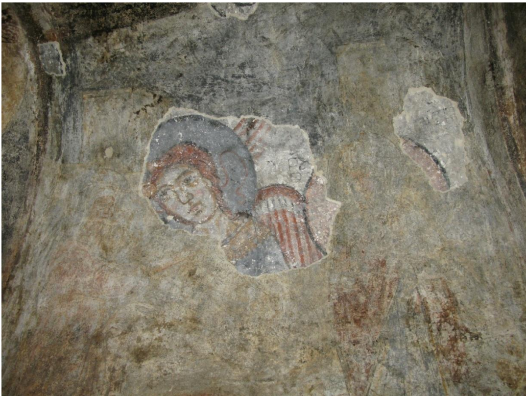
15. პირველი სართული. სამხრეთის კედელი. ზედა ფენის მხატვრობა და მოჩანს ქვედა ფენის ანგელოზი