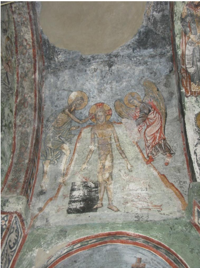
7. ჩრდილოეთ კედელი