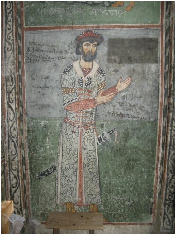
1. ჩრდილოეთ კედელი.