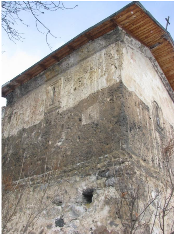
19. სამხრეთ-აღმოსავლეთის ხედი