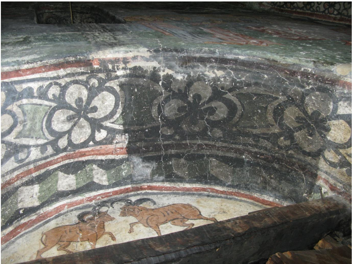
3. დასავლეთ კარი.