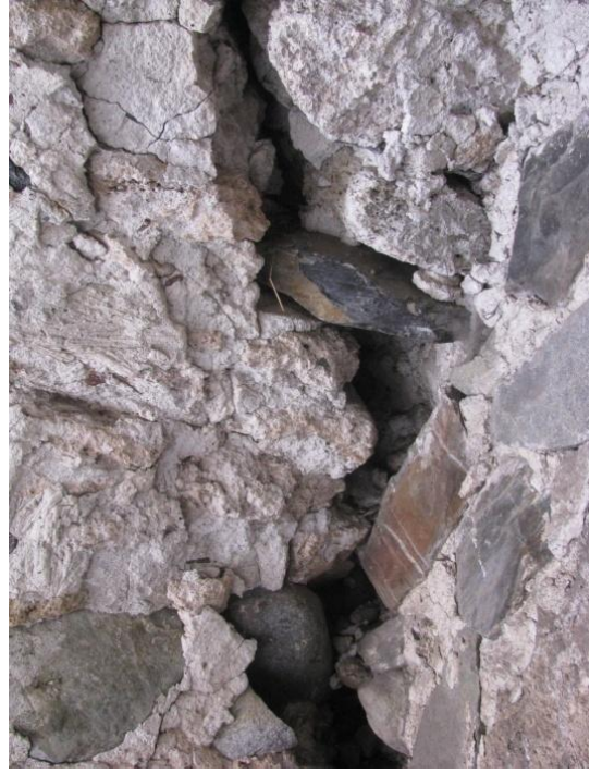
დაბზარული კედლები. სამხრეთ ნაწილი