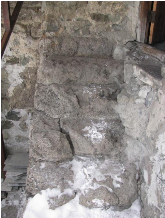
სართულზე ასასვლელი კიბე