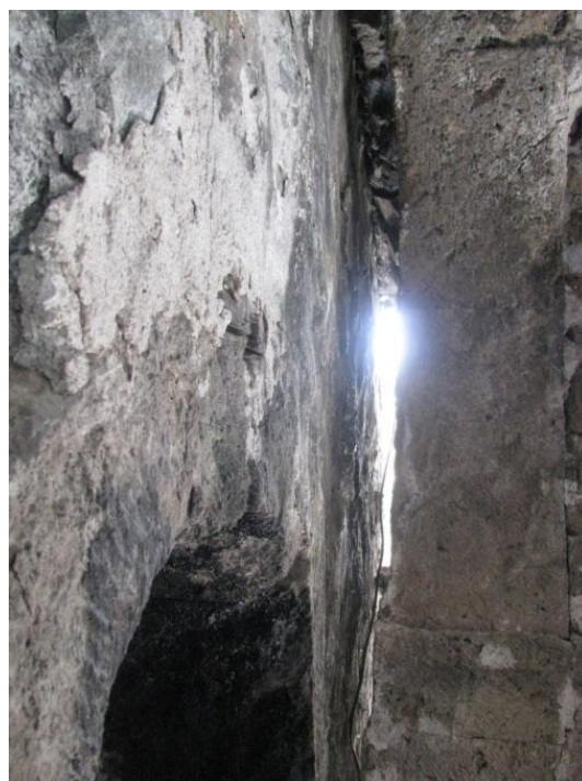
საბჯენი თალი ცენტრალურ ნაწილში