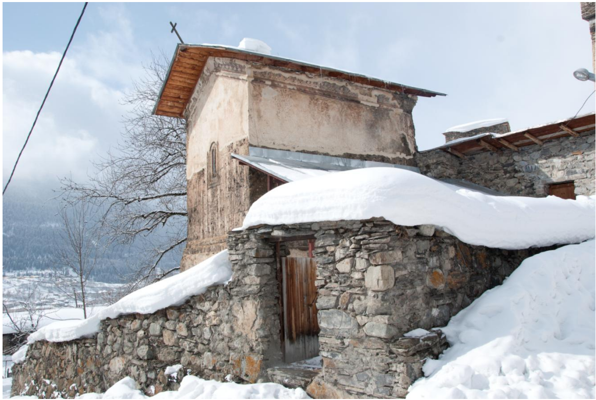
18. საერთო ხედი ჩრდილო-აღმოსავლეთიდან