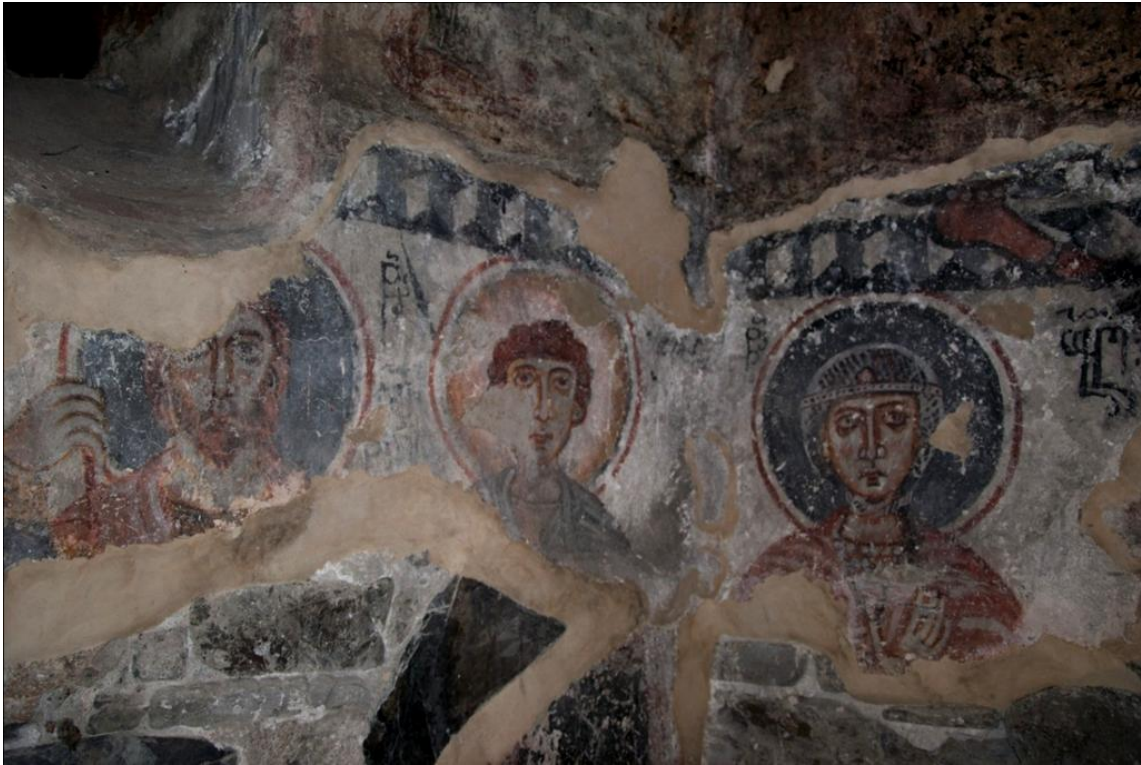
16. ქვედა ფენის მხატვრობა. სამხრეთ კედელი. წმ. გიორგის შარავანდედზე, მარცხენა მხარეს ოდნავაა ბათქაში შემტვრეული