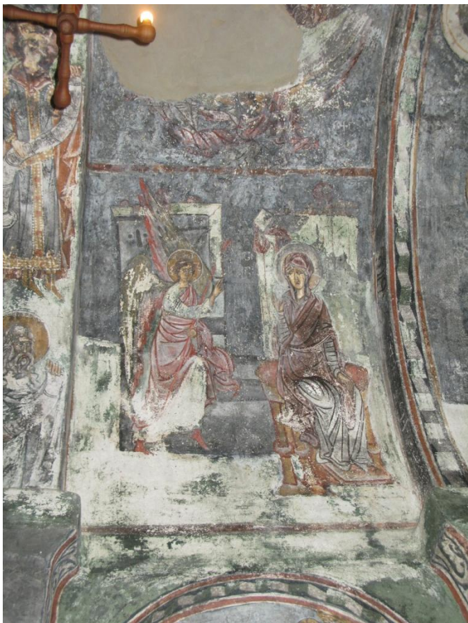
9. ჩრდილოეთ კედელი