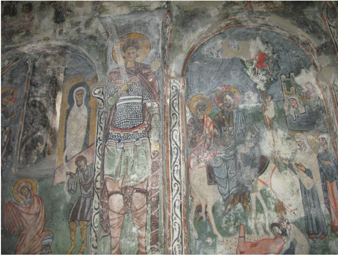
4. სამხრეთ კედელი