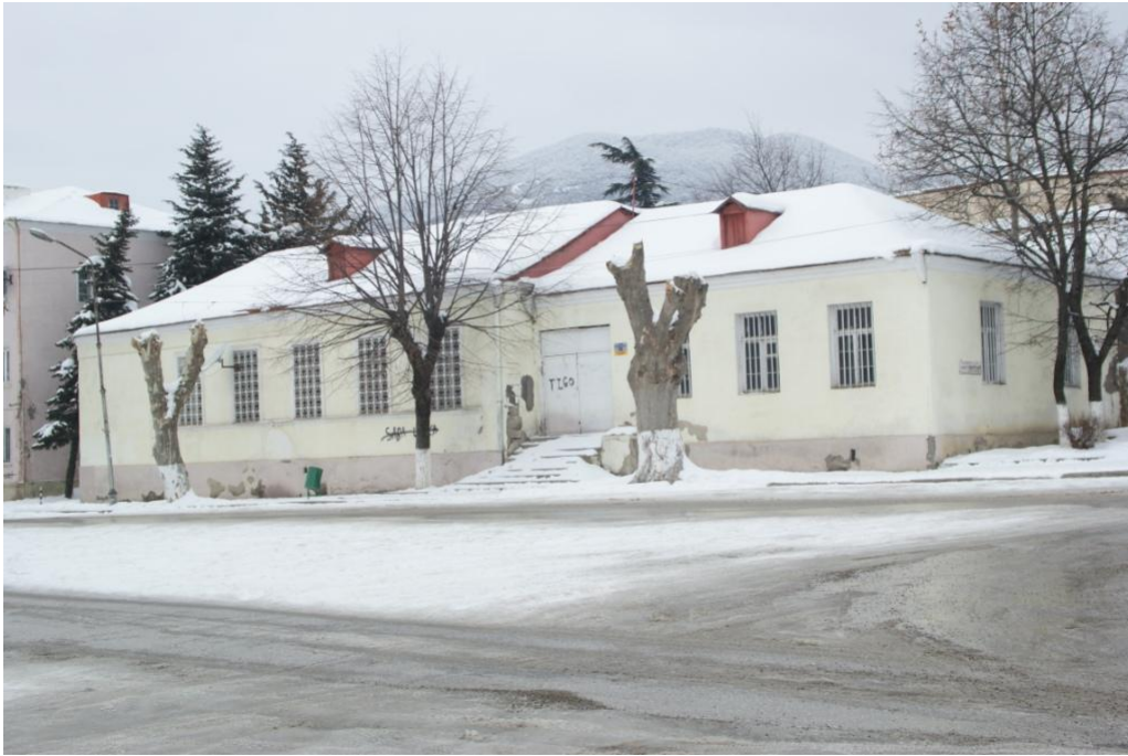
დავით აღმაშენებლის ქუჩაზე არსებული შენობების ფასადების რეაბილიტაცია და იერსახის შეცვლა