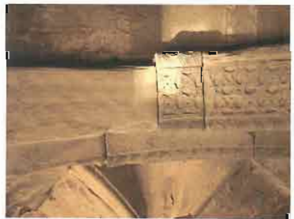
ნრდილოეთი კარიბჭე - დაზიანებული თაღის ორნამენტული ქვა