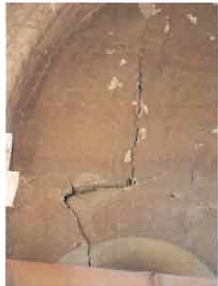
სურ.2 ბზარი კარიბჭის ღიობის თავზე

აღმოსავლეთ ფასადზე გვხვდება როგორც დიდი ბზარები, ასევე ბზარები, რომლებიც მხოლოდ ცალკეულ ქვაზე ვრცელდება. ხოლო სტრუქტურული ბზარები ძირითადად თავმოყრილია კარიბჭეზე. ყველაზე მეტად დაზიანებულია კარიბჭის ჩრდილოეთი ნაწილი. კედლის შიდა მხარეს, ღიობებთან განვითარებულია ბზარი, რომელიც კამარის სიმაღლემდე ვრცელდება. ფასადის მხარეს კი საპირე წყობა დანარჩენ კედლს დაშორებულია - ინტერიერის და ფასადის საპირე წყობის ქვები ერთმანეთისგან გაწეულია დაახლოებით 7-8სმ. ღიობების მიმდებარედ დაკარგულია დუღაბი. არის კიდევ ერთი ბზარი ეკლესიის ჩრდილოეთი კარის თავზე – კარიბჭესთან. (სურ. 2,3)