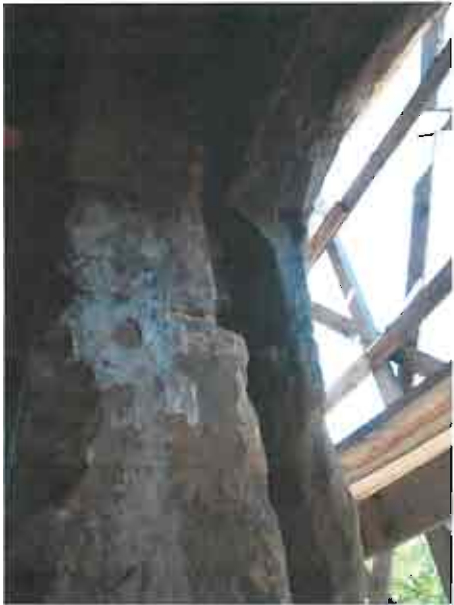
სურ. 3 კარიბჭის ჩრდილოეთ ღიობთან გახსნილი კედლის ნაწილი

პრობლემა აქვს ასევე დუღაბს. აღმოსავლეთ ფასადზე რამოდენიმე ადგილას, ხოლო კარიბჭის მრავალ მონაკვეთზე, განსაკუთრებით ჩრდილოეთ კედელზე, ქვებს შორის დუღაბი დაკარგულია. ეს გამოწვეული უნდა იყოს ზედმეტი ფიზიკური დატვირთვით და ბუნებრივი აგენტების მოქმედებით. როგორც ჩანს ჩრდილოეთ კედელზე რაღაც პერიოდში წყალი აქტიურად მოქმედებდა, რამაც გამოიწვია ღიობებთან დუღაბის დაკარგვა. თუმცა დღეს ამ ნაწილში წყლის პრობლემა მოხსნილია.