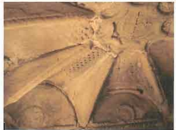
ნრდილოეთი კარიბჭე - დაზიანებული კამარა