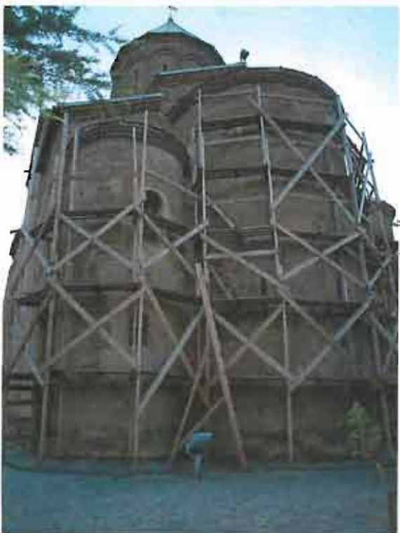
ხედი სამხრეთ-აღმოსავლეთი მხრიდან