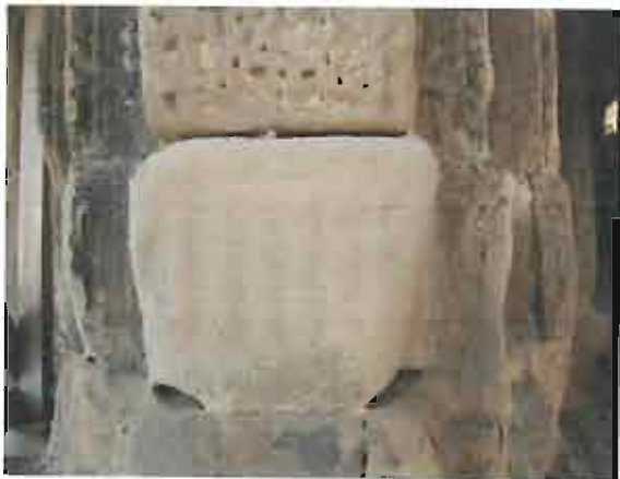
ჩრდილოეთი კარიბჭე - დაზიანებული ორნამენტული ქვა