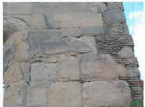
დასავლეთი ფასადის სამხრეთი კუთხე - დაზიანებული სამშენებლო მასალა