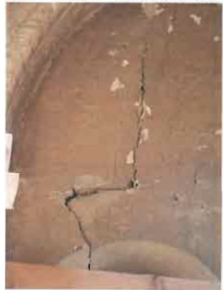
სურ.2 ბზარი კარიბჭის ღიობის თავზე

აღმოსავლეთ ფასადზე გვხვდება როგორც დიდი ბზარები, ასევე ბზარები, რომლებიც მხოლოდ ცალკეულ ქვაზე ვრცელდება. ხოლო სტრუქტურული ბზარები ძირითადად თავმოყრილია კარიბჭეზე. ყველაზე მეტად დაზიანებულია კარიბჭის ჩრდილოეთი ნაწილი. კედლის შიდა მხარეს, ღიობებთან განვითარებულია ბზარი, რომელიც კამარის სიმაღლმდე ვრცელდება. ფასადის მხარეს კი საპირე წყობა დანარჩენ კედლს დაშორებულია - ინტერიერის და ფასადის საპირე წყობის ქვები ერთმანეთისგან გაწეულია დაახლოებით 7-8სმ. ღიობების მიმდებარედ დაკარგულია დუღაბი. არის კიდევ ერთი ბზარი ეკლესიის ჩრდილოეთი კარის თავზე - კარიბჭესთან. (სურ. 2,3)