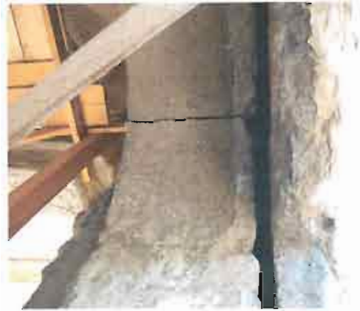
ნრდილოეთი კარიბჭე - ბზარი ნრდილოეთი კედლის ღიობთან