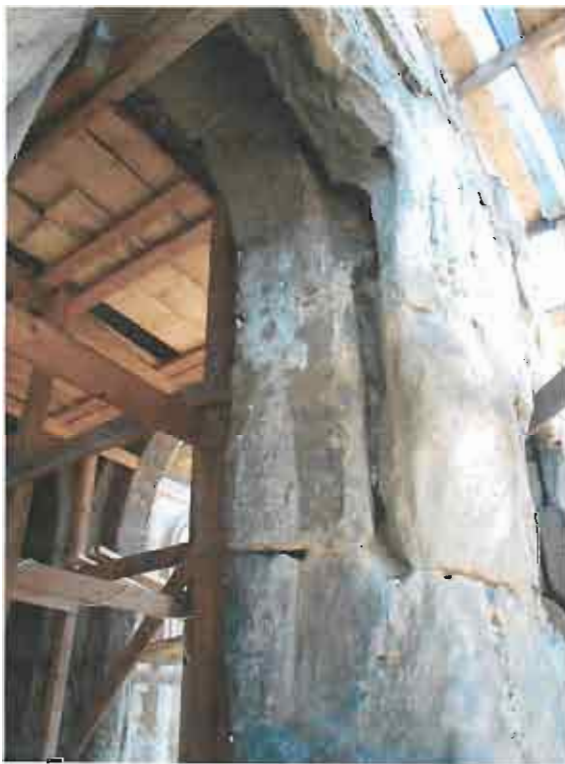
ნრდილოეთი კარიბჭე - ნრდილოეთი კედლის გადმოწეული ნაწილი