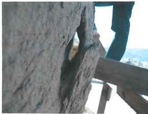
ჩრდილოეთი კარიბჭე - დაზიანებული სამშენებლო მასალა