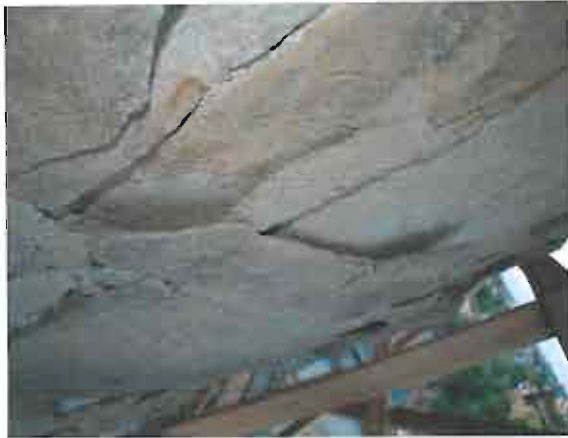
აღმოსავლეთი ფასადი, ცენტრალური აფსიდი - დაზიანებული სამშენებლო მასალა