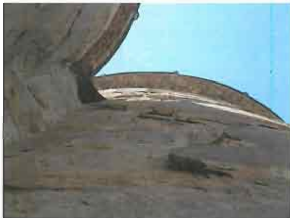
აღმოსავლეთი ფასადი, ცენტრალური აფსიდი - დაზიანებული სამშენებლო მასალა (2012წ.)