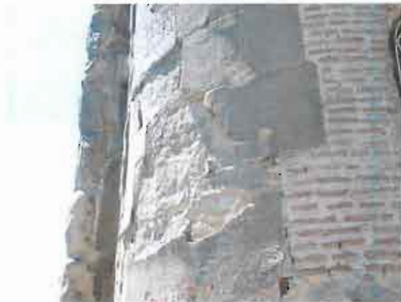
აღმოსავლეთი ფასადი, სამხრეთი აფსიდი - დაზიანებული სამშენებლო მასალა (2012წ.)