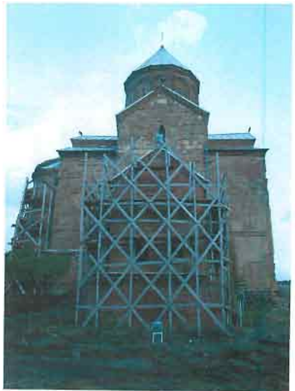
ჩრდილოეთი ფასადი - ხაერთო ხედი