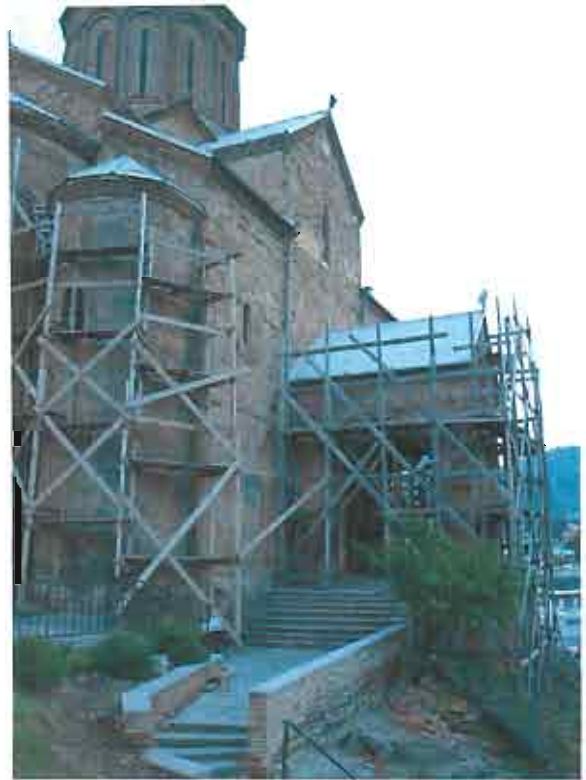
ხედი ჩრდილო-აღმოსავლეთი მხრიდან