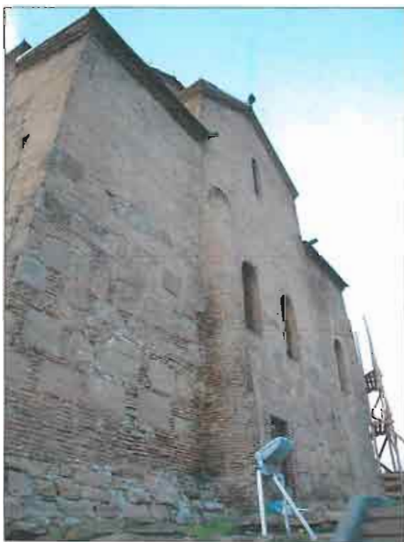
ხედი სამხრეთ-დასავლეთი მხრიდან