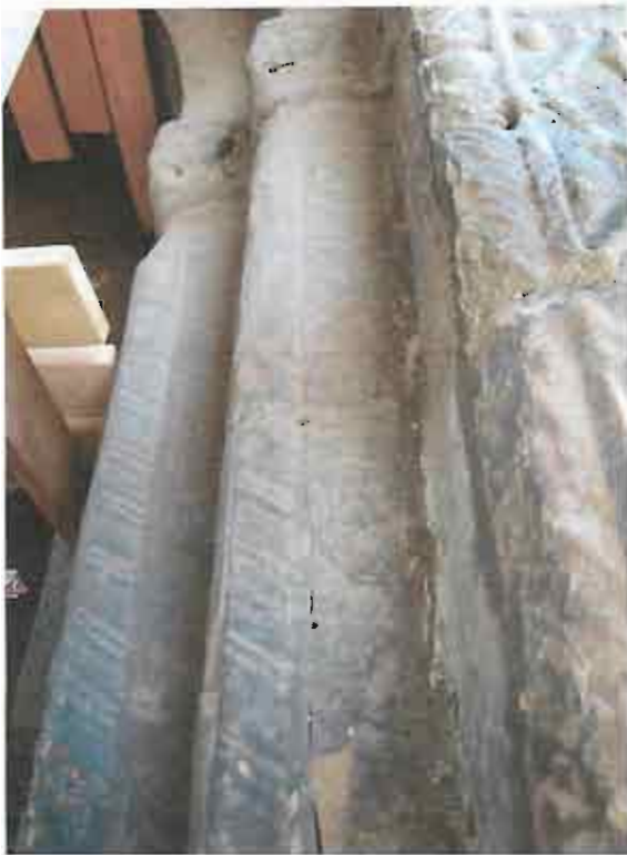
ნრდილოეთი კარიბჭე - სხედასხვა სახის დაზიანება და ნაღები