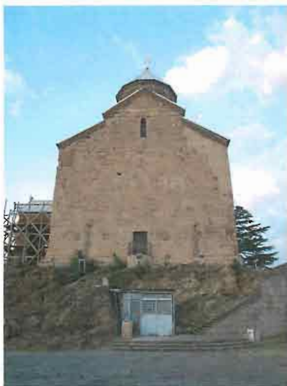
დასავლეთი ფასადი - საერთო ხედი