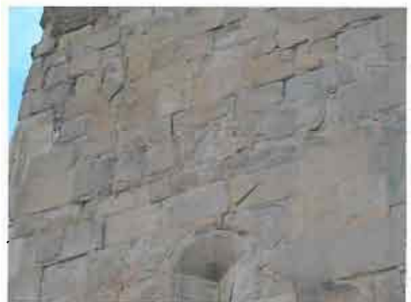
დასავლეთი ფასადის ჩრდილოეთი კუთხე - დაზიანებული სამშენებლო მასალა