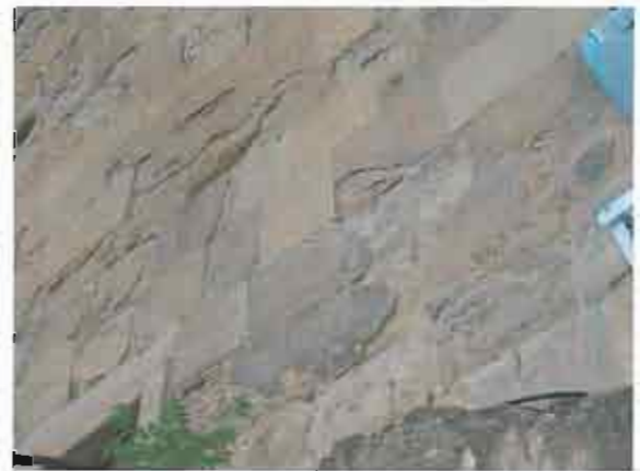
დასავლეთი ფასადი - დაზიანებული სამშენებლო მასალა