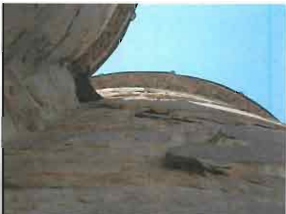
აღმოსავლეთი ფასადი - სამშენებლო მასალის განშრეკებული ზედაპირი (2012წ.)