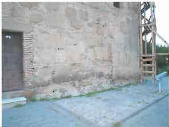
სამხრეთ ფასადის აღმოსავლეთი კუთხე - დაზიანებული სამშენებლო მასალა